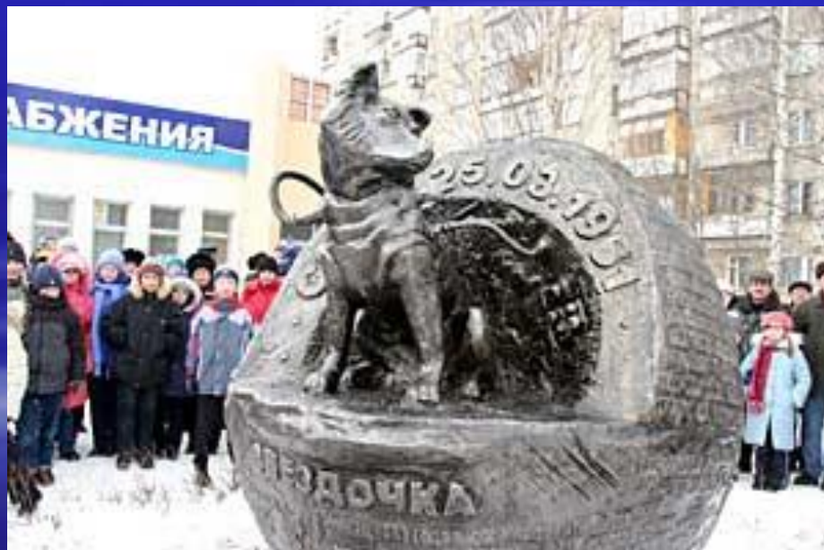
Памятник Звездочке в Ижевске