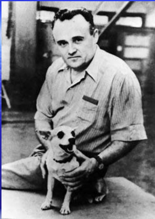
Сергей Павлович Королев