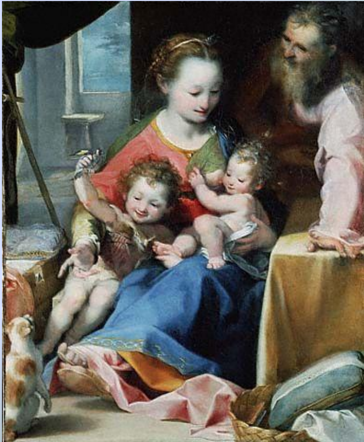
Рембрандт «Мадонна с младенцем И Св. Иосифом»

Женщина, мать стала воплощением кисти великих мастеров искусства: Рембранта, Венецианова, Тropicина, Серова.