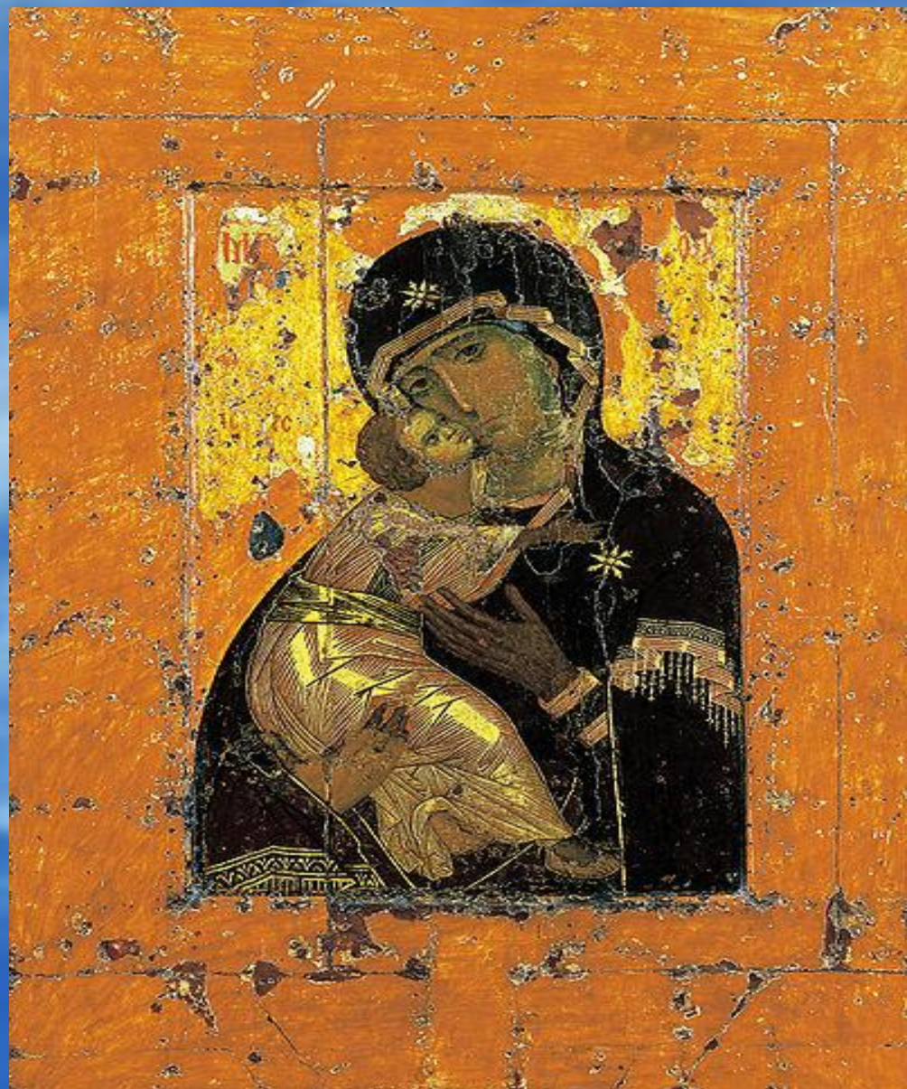
Россия г. Тихвин Тихвинский Богородичный Успенский