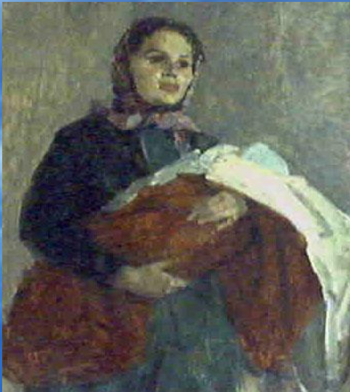
Марина Иванова «Женщина с ребенком» 1962