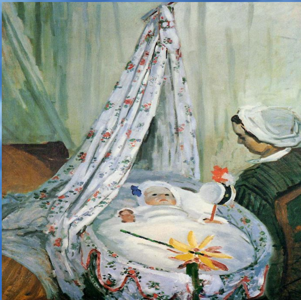
Клод Моне «Жан Моне в колыбели» 1867