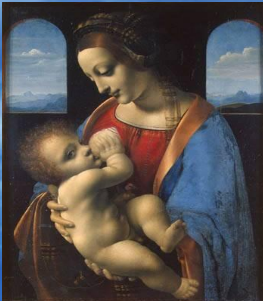
Мадонна с младенцем (Мадонна Литта)