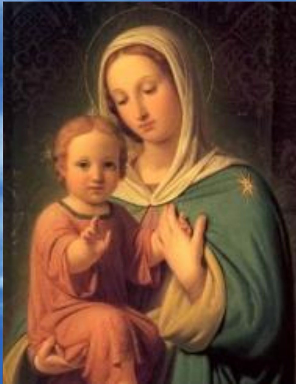
Дева Мария с младенцем