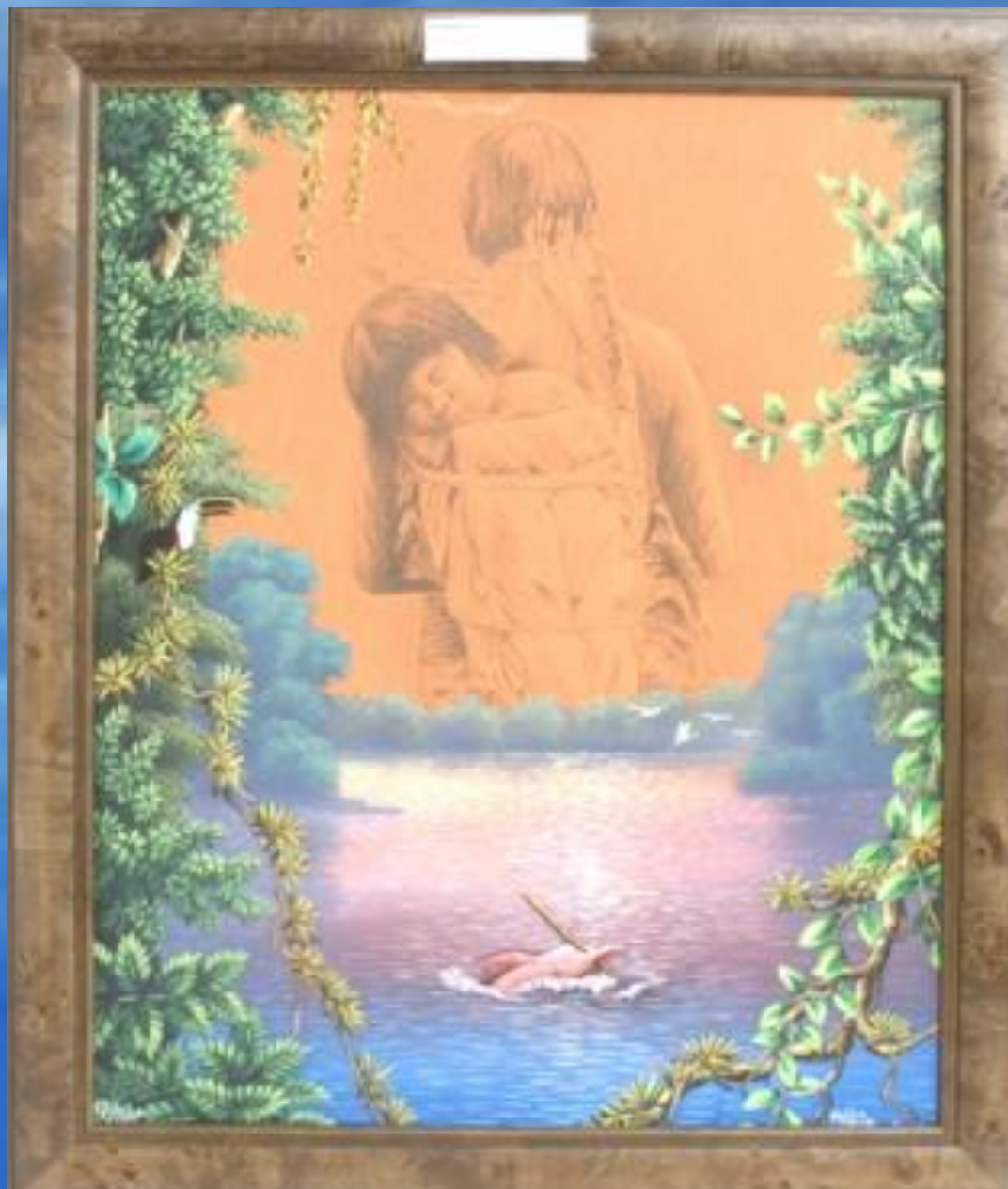
Картина «Женщина с ребенком племени»