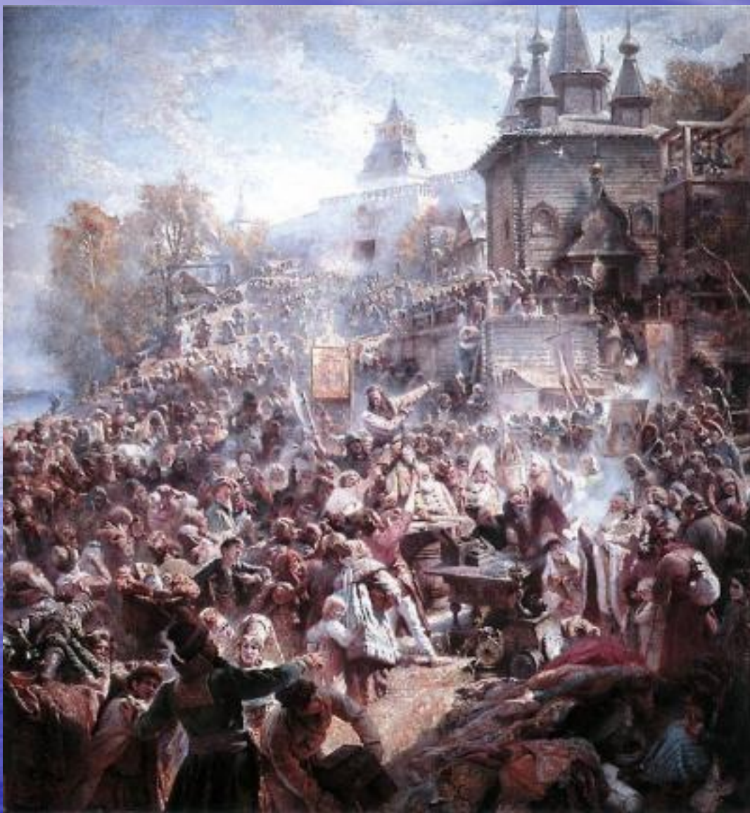
Народное ополчение Минина и Пожарского