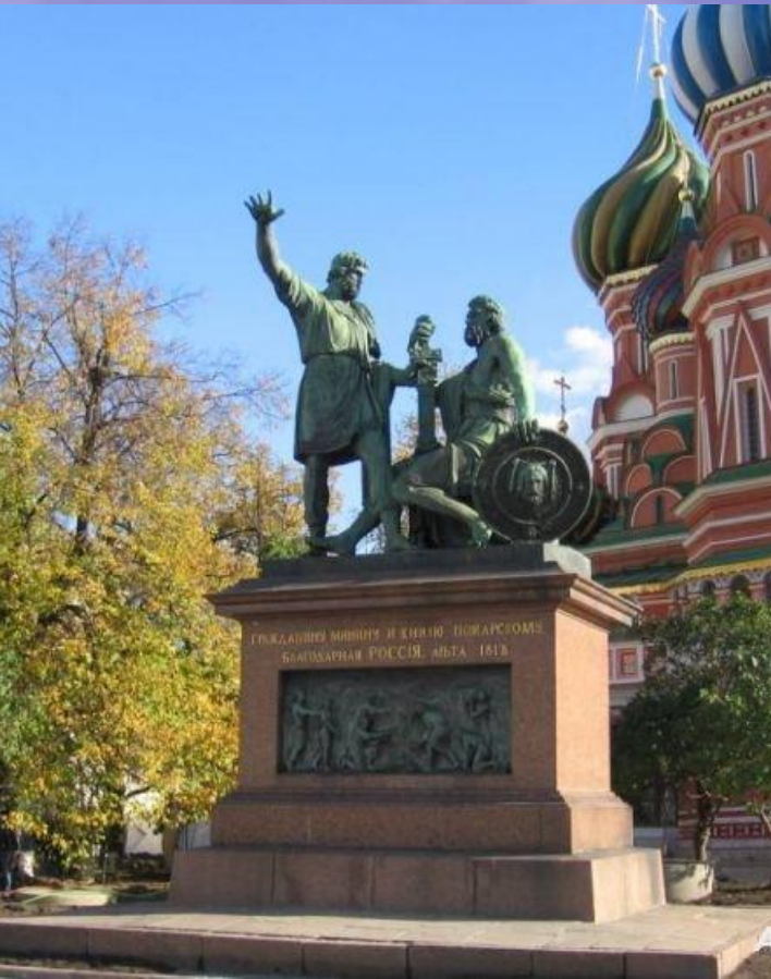
Памятник Минину и Пожарскому в Москве