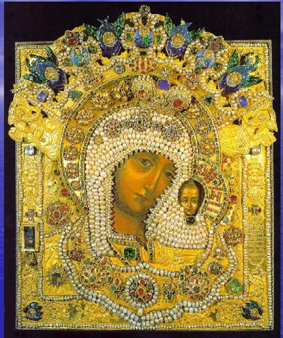
Икона Казанской Божьей Матери