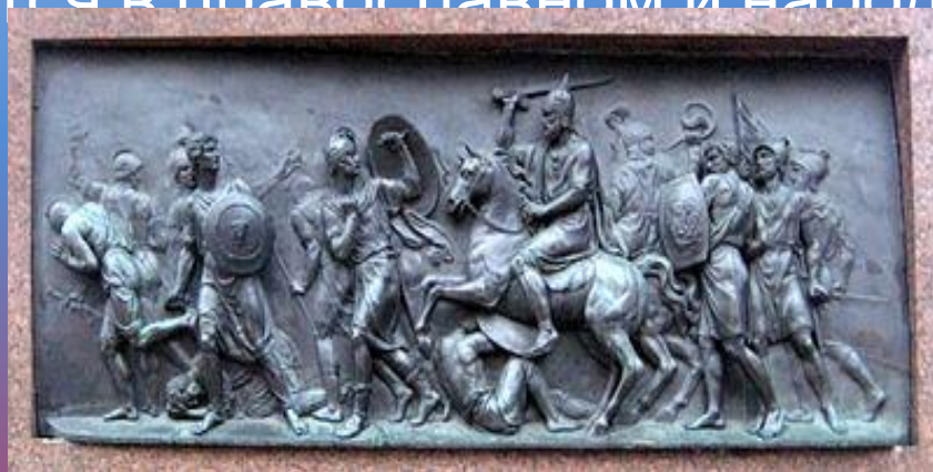
Горельеф с памятника Минину и Пожарскому