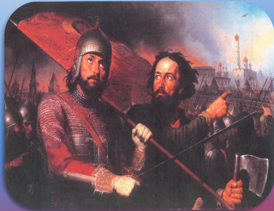
Князь Дмитрий Пожарский (слева) и Кузьма Минин