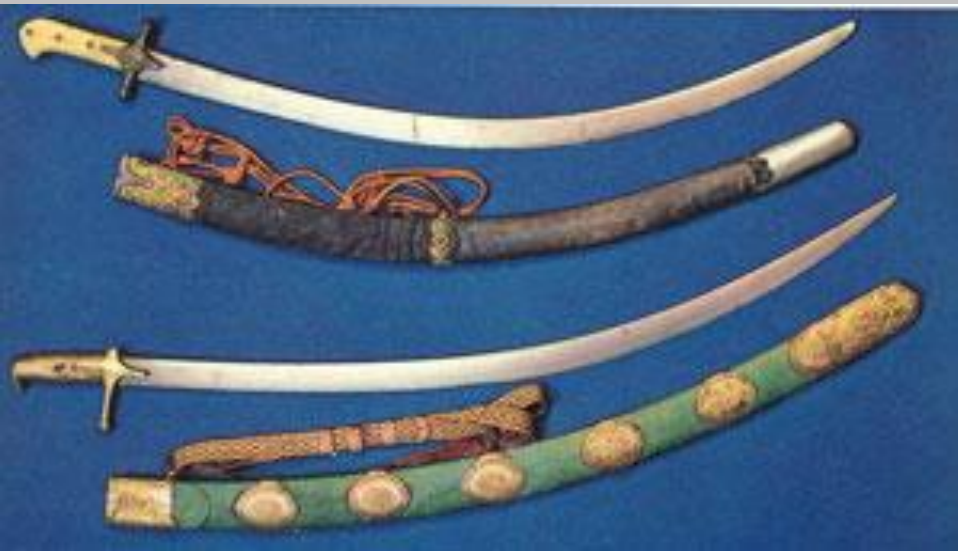
Сабли Минина и Пожарского