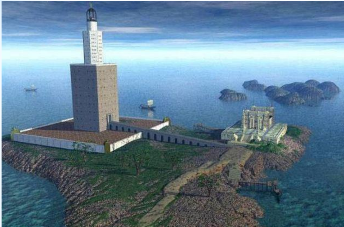
Маяк в Александрии