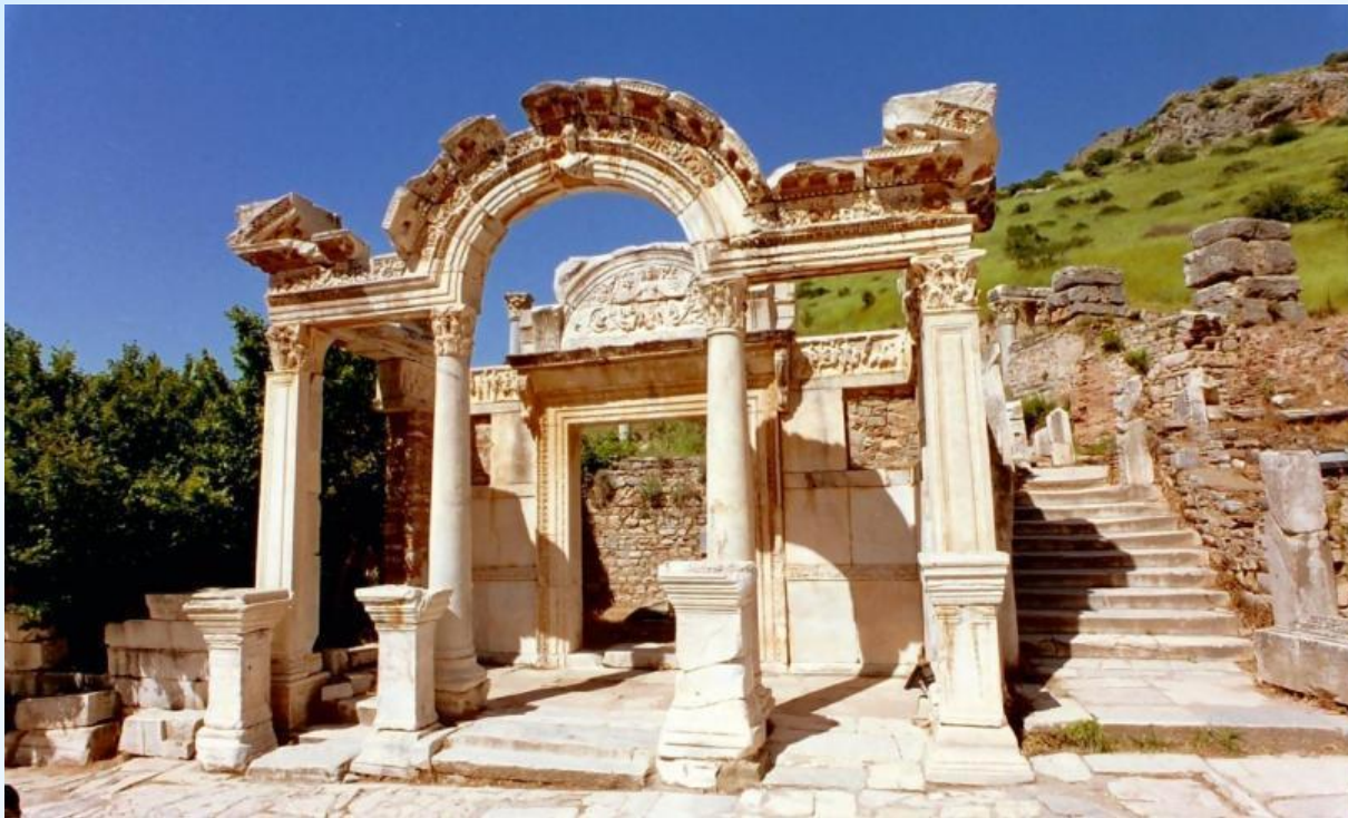
Храм Артемиды в Эфесе