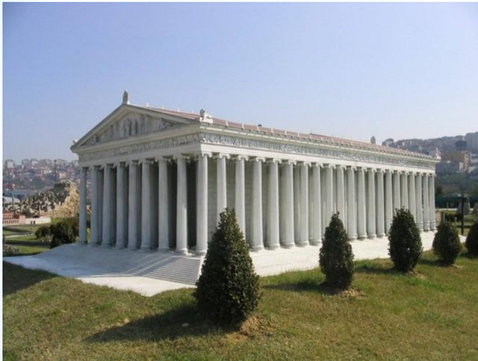
Мавзолей в Галикарнасе