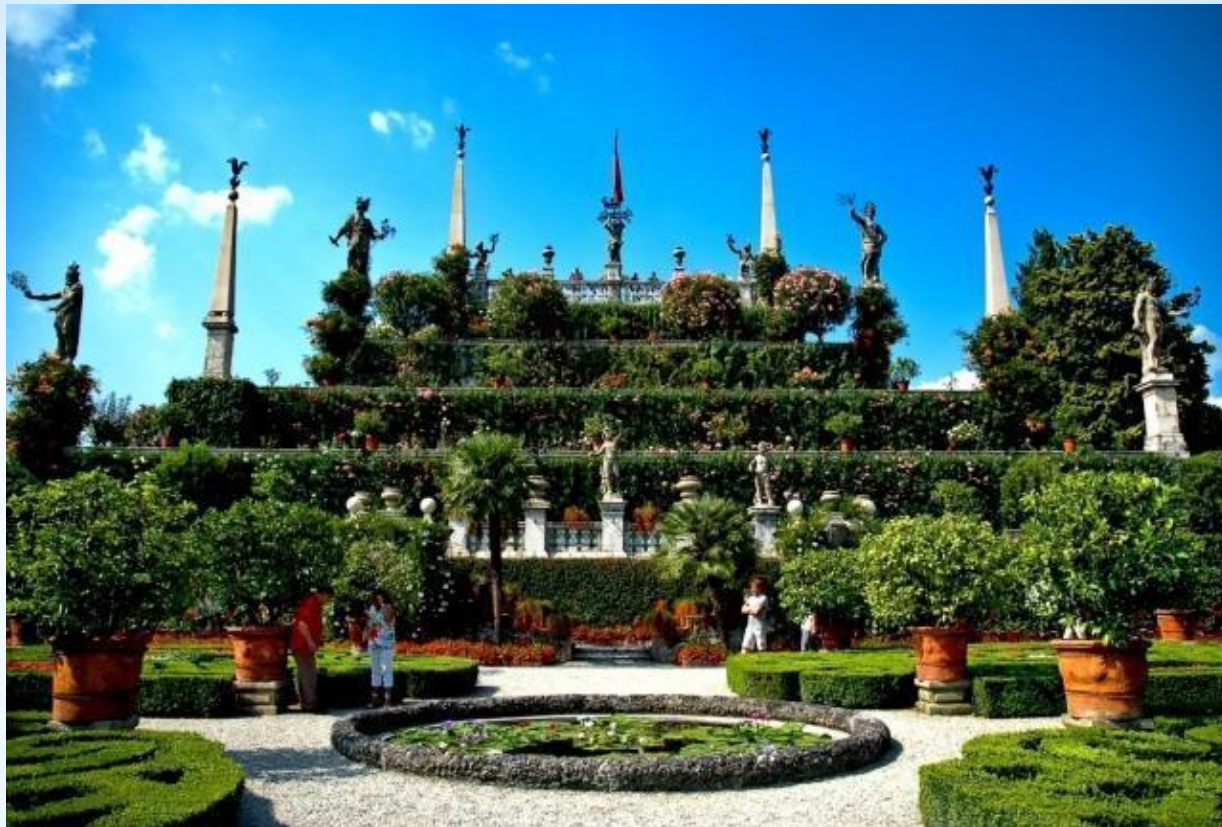
Висячие сады Семирамиды