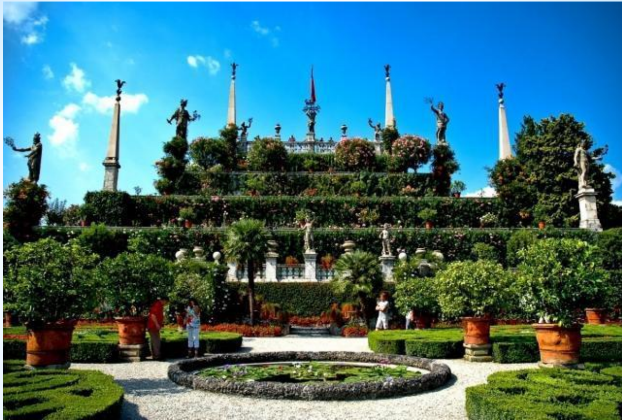
Висячие сады Семирамиды