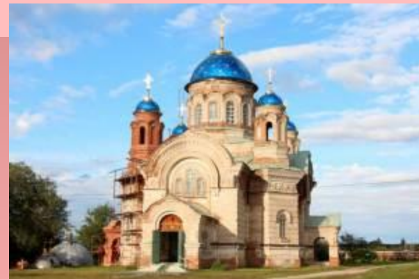
г. Верхняя Теча - граждане пенсионного возраста села Покровское, 12 человек.