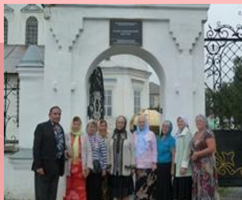
Ганина Яма • 13 человек - из села Сипавское; • 13 человек - из села Колчедан ; • 12 человек -из села Сипавское