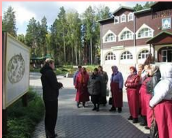
Храм на крови, Ганина Яма, 12 человек.