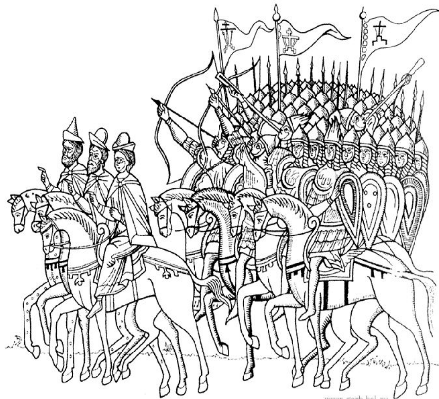
Стяги новгородской дружины XIII в. на иконе “Битва новгородцев с суздальцами”. Новгород, XV в. Прорисовка А. Г. Силаева.

Приводим прорисовку А.Г. Силаева с иконы “Благословенно воинство Царя Небесного” (фрагмент “Битва новгородцев с суздальцами”). Новгород, XV в.