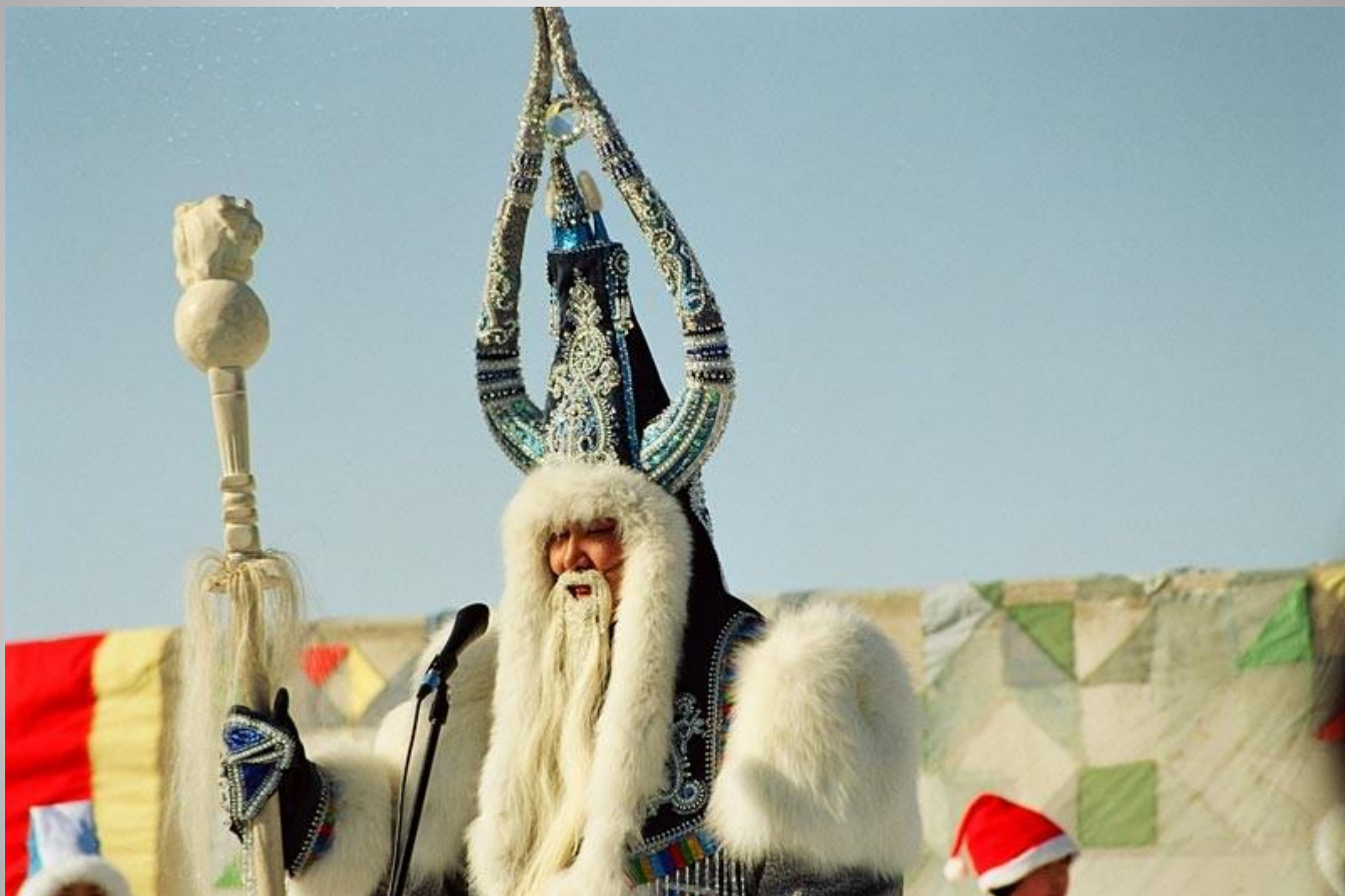
Якутский Дед Мороз Чисхан