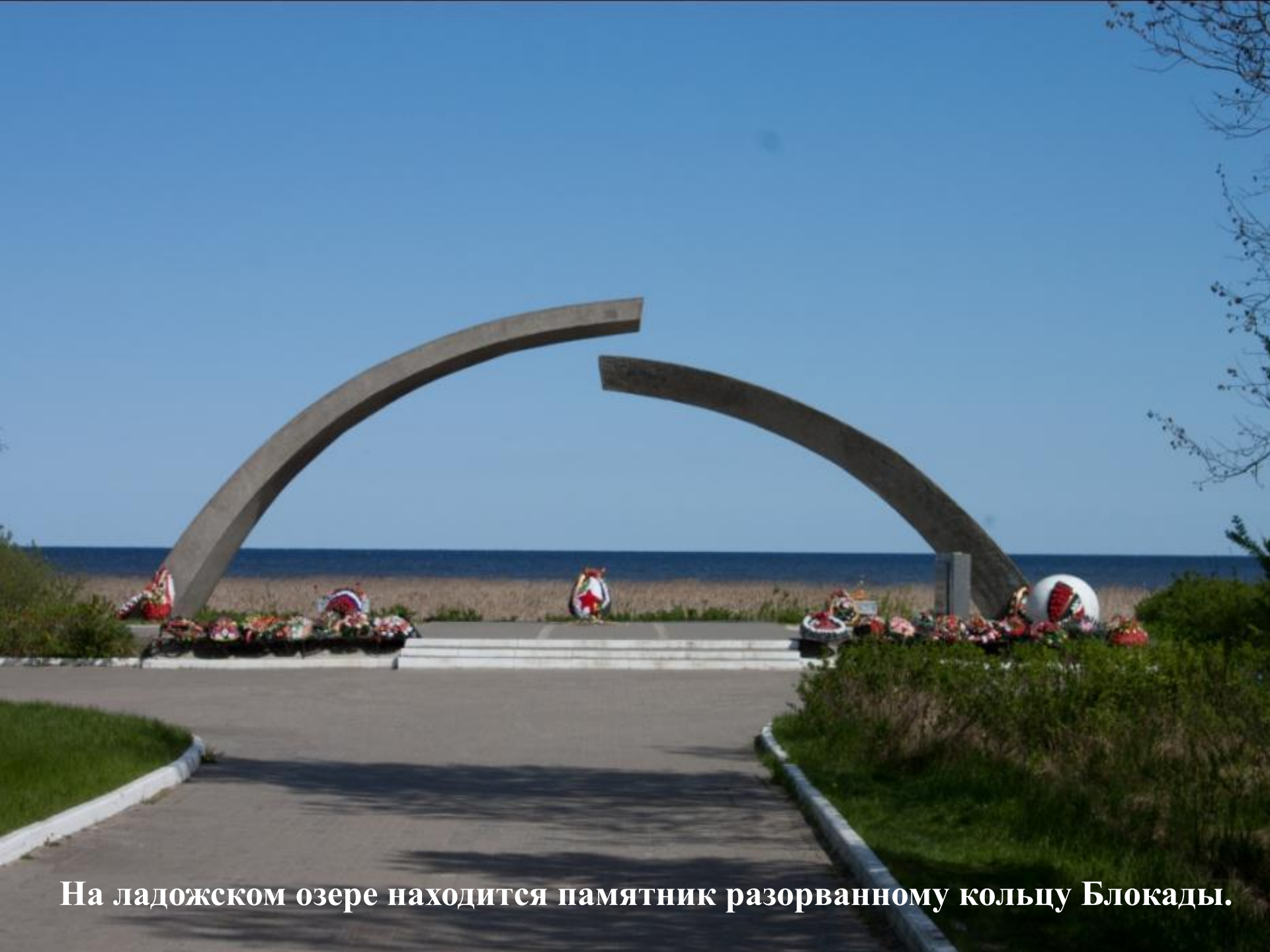
На ладожском озере находится памятник разорванному кольцу Блокады.