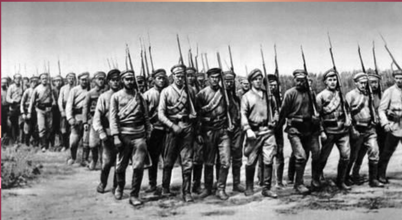
Один из первых полков Красной Армии