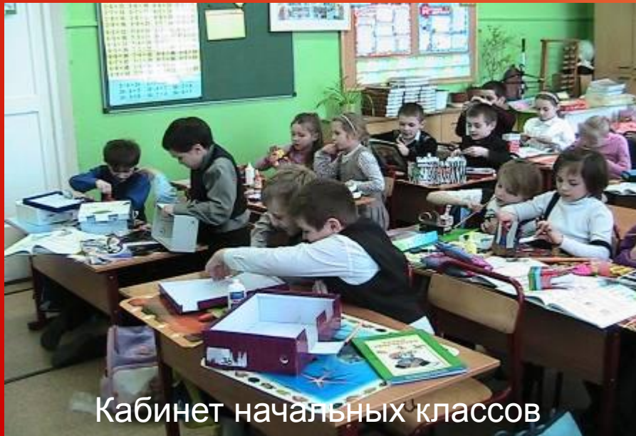
Кабинет начальных классов