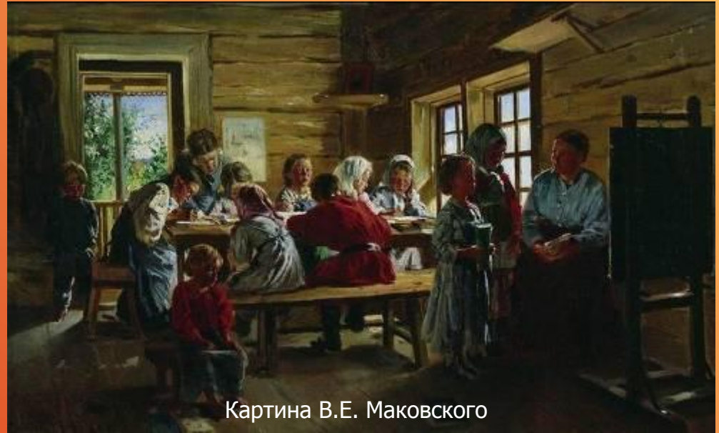
Картина В.Е. Маковского