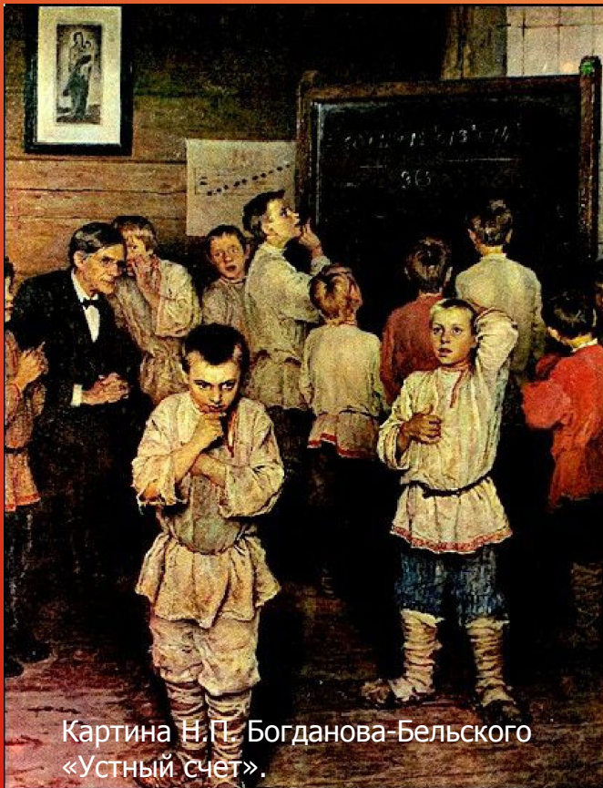
Картина Н.П. Богданова-Бельского «Устный счет».

Гравюра из «Азбуковника» Бурцева (1637 г.)