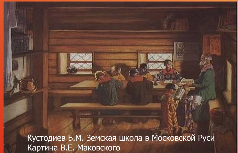
Кустодиев Б.М. Земская школа в Московской Руси Картина В.Е. Маковского