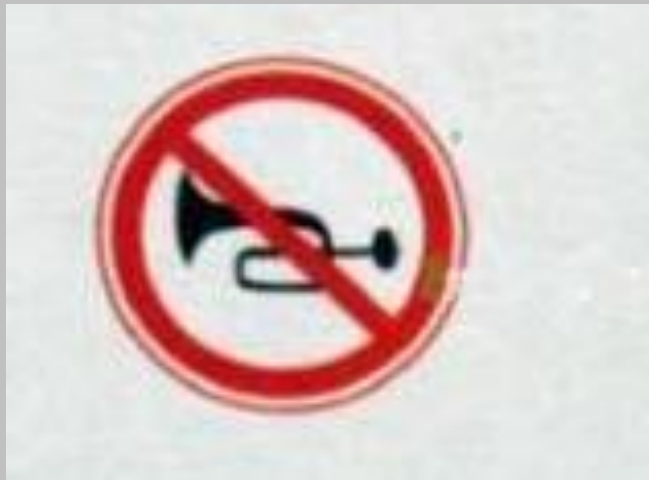
Подача звукового сигнала запрещена