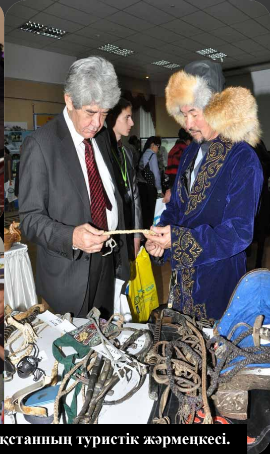
«Сарқылмас саяхат» - Қазақстанның туристік жәрмеңкесі.

ASTANA LEISURE 2010 – бұл жаңа контракттар мен қызметтер, жаңа саяси маңызды контракттармен алмасу болып табылады. Бұған үнемі қатысатын қатысушылар: ірі отандық және халықаралық туристік компаниялар . «ASTANA LEISURE 2010» Қазақстанның, Орталық Азияның, алыс және жақын шетелдерден 5000 астам келушілер келеді. 2008 жылдың 6-8 қазанында Астана қаласында «Көрме» көрмелік кешенінде 6-шы Қазақстандық халықаралық туристік көрме өтті.