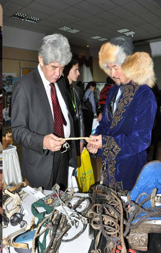
«Сарқылмас саяхат» - Қазақстанның туристік жәрмеңкесі.

ASTANA LEISURE 2010 – бұл жаңа контракттар мен қызметтер, жаңа саяси маңызды контракттармен алмасу болып табылады. Бұған үнемі қатысатын қатысушылар: ірі отандық және халықаралық туристік компаниялар . «ASTANA LEISURE 2010» Қазақстанның, Орталық Азияның, алыс және жақын шетелдерден 5000 астам келушілер келеді. 2008 жылдың 6-8 қазанында Астана қаласында «Көрме» көрмелік кешенінде 6-шы Қазақстандық халықаралық туристік көрме өтті.