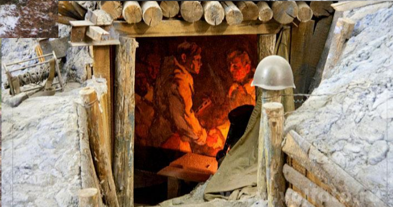
Фрагмент панорамы с разгром немецко-фашистских войск под Сталинградом