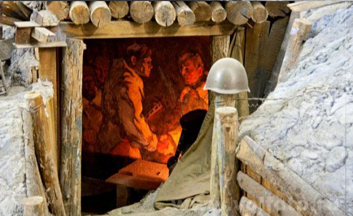
Фрагмент панорамы с разгром немецко-фашистских войск под Сталинградом