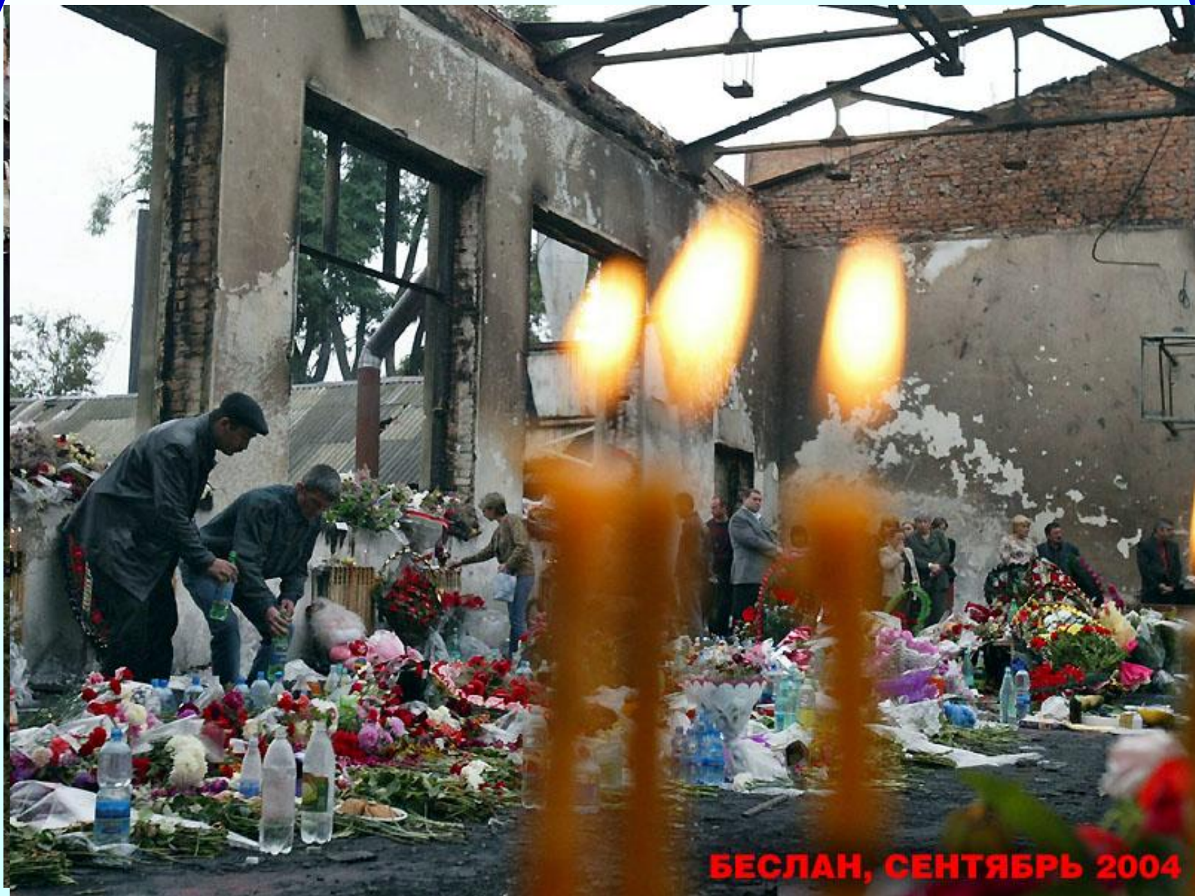
БЕСЛАН, СЕНТЯБРЬ 2004