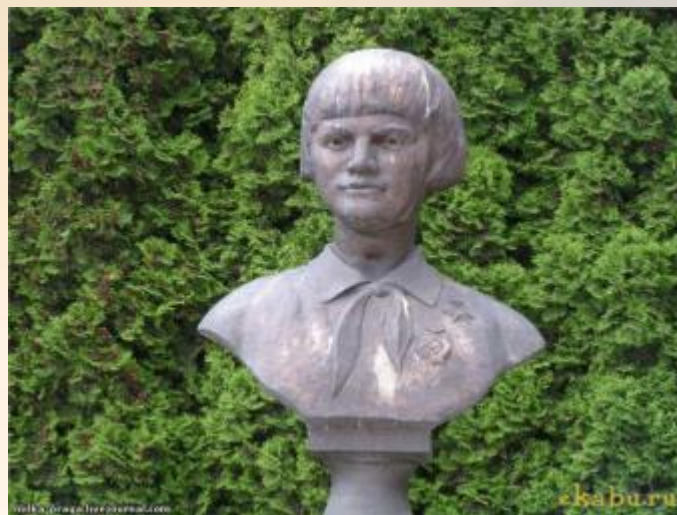
В столице Белоруссии — городе-герое Минске установлен бюст Зины Портновой, а около посёлка Оболь — обелиск.