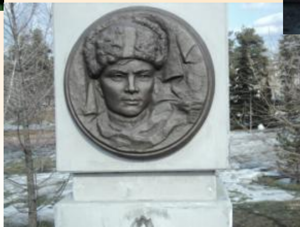
Памятник Вале Котыку на Аллее пионеро-героев г. Челябинск