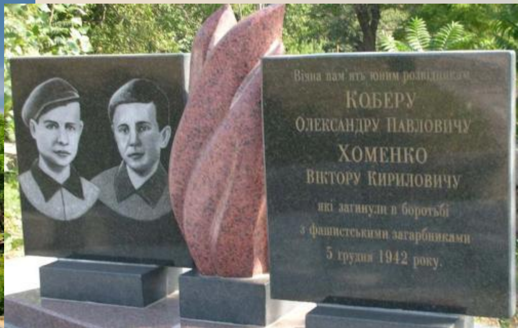
г. Николаев (Миколаїв), Николаевская область, Украина