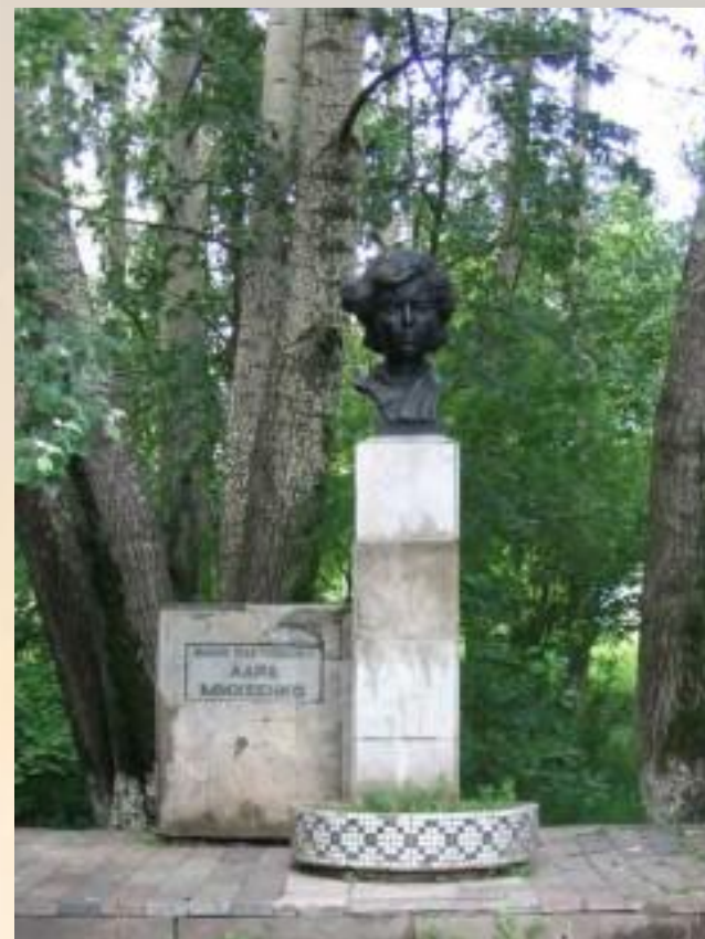
Хотьково, улица Майолик, памятник Ларе Михеенко