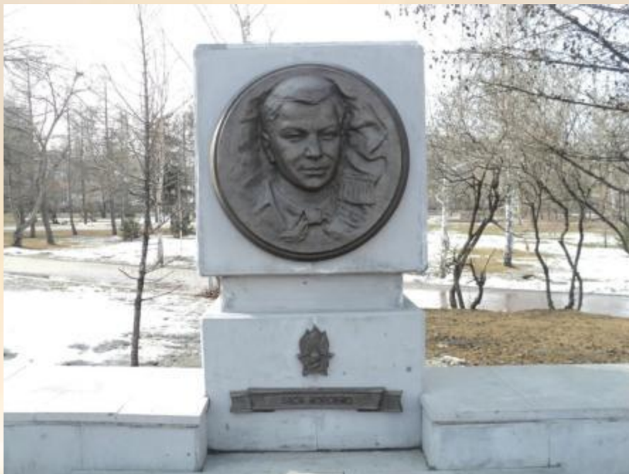
Памятник Васье Коробко на Аллее пионеров-героев