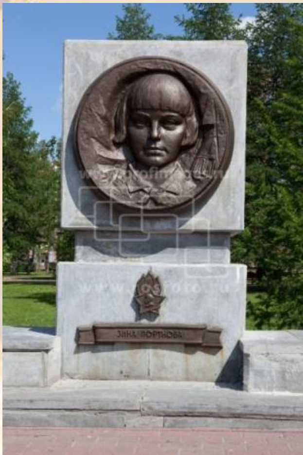
Челябинск. На улицах города. Парк "Алое поле". Аллея пионеров-героев. Зина Портнова