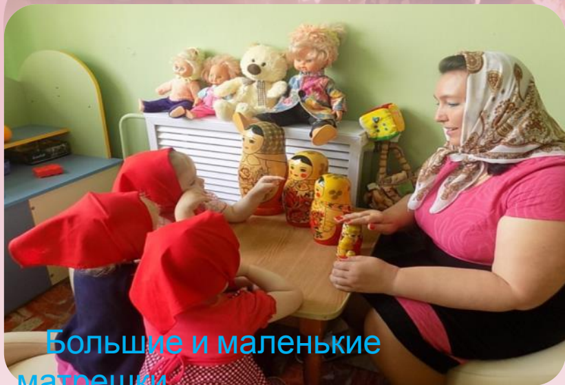
Большие и маленькие матрешки