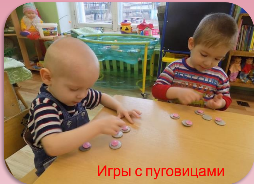
Игры с пуговицами