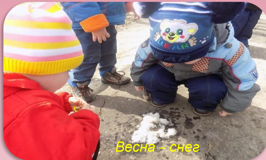
Весна – снег тает