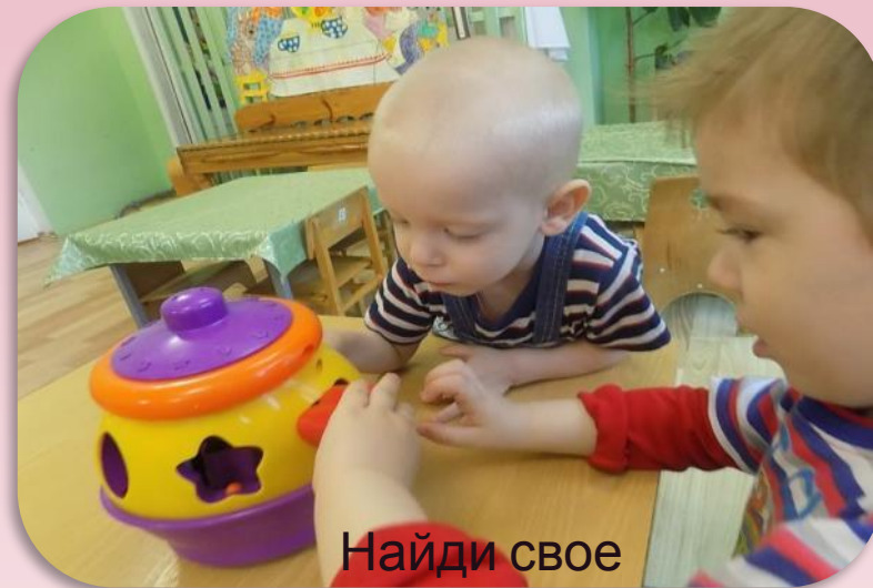
Найди свое окошечко