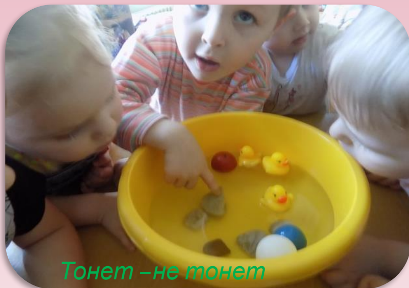
Тонет – не тонет