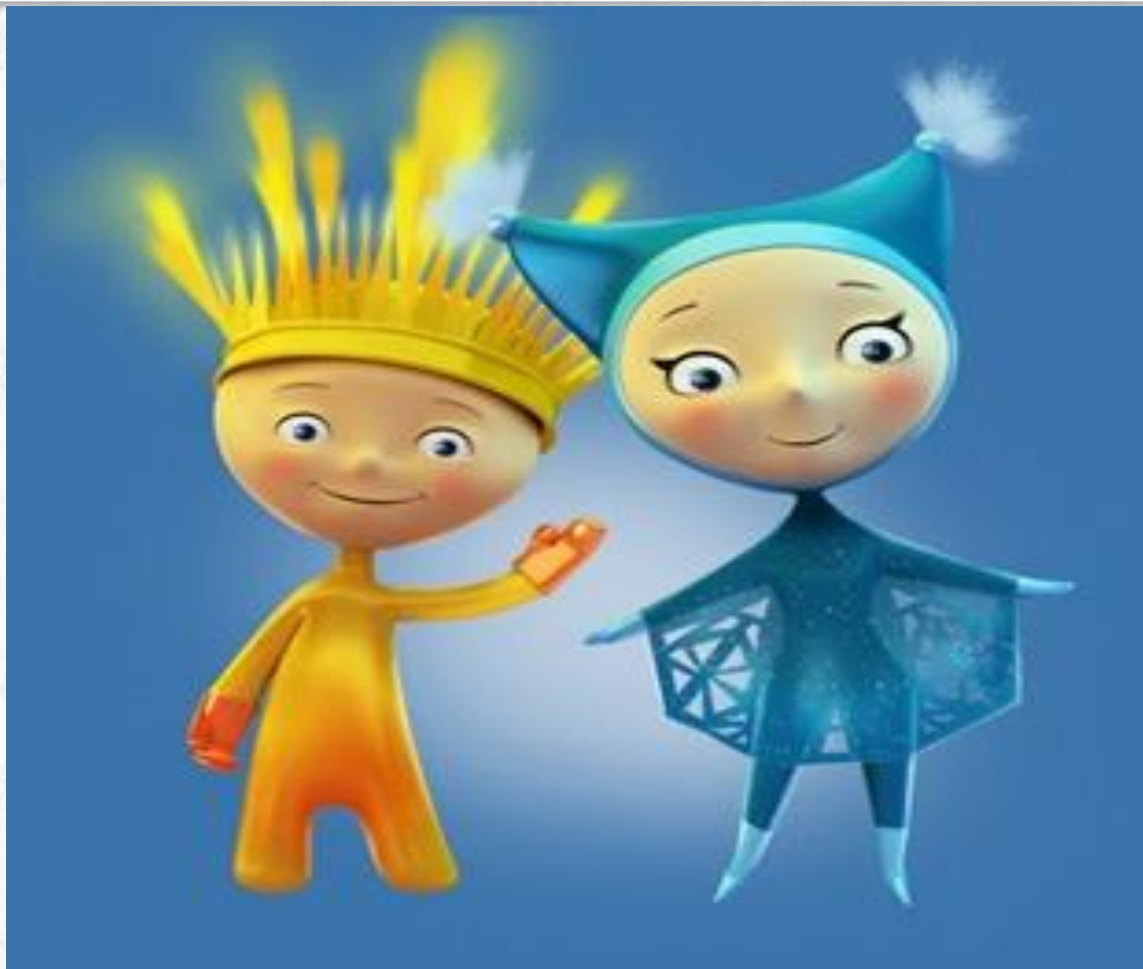
Талисманы параолимпийских игр в Сочи