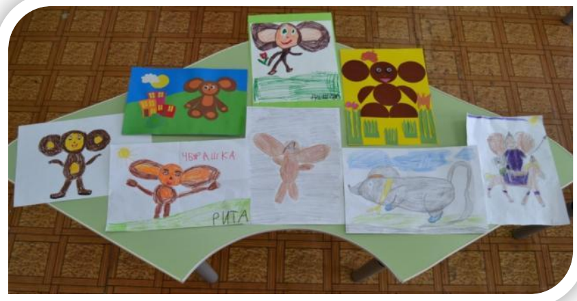
Творческие работы детей и родителей