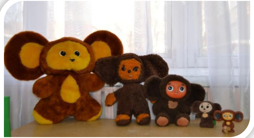
Коллекция Чебурашек. Самому старшему – 30 лет.