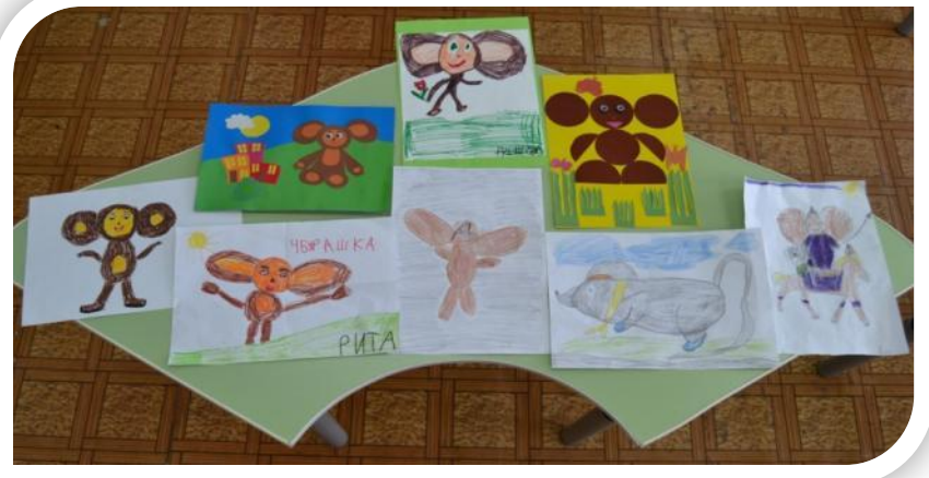
Творческие работы детей и родителей