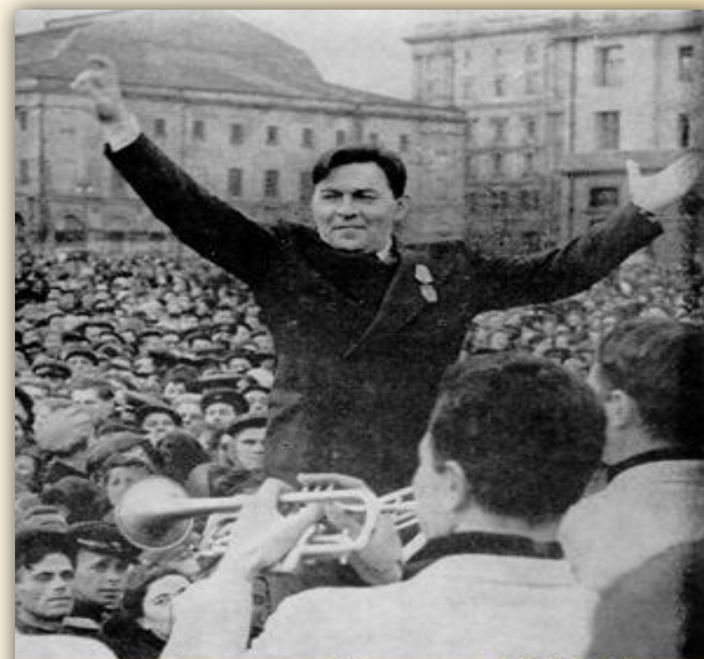
Выступление Госджаза РСФСР п/у Л.Утесова на площади Свердлова в Москве 9 мая 1945 года.