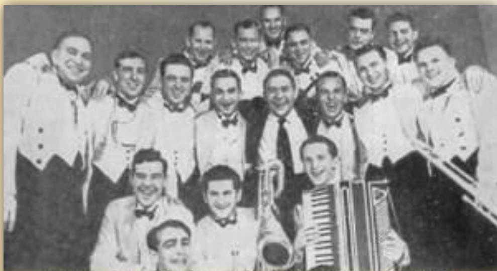
Госджаз РСФСР п/у Л.Утесова. 1938 г.