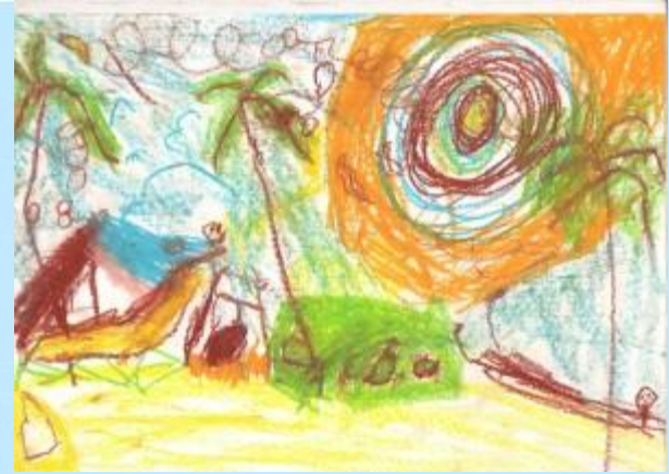
Рисунок для ребенка является не искусством, а речью. Рисование дает возможность выразить то, что в силу возрастных ограничений он не может выразить словами. В процессе рисования рациональное уходит на второй план, отступают запреты и ограничения. В этот момент ребенок абсолютно свободен.