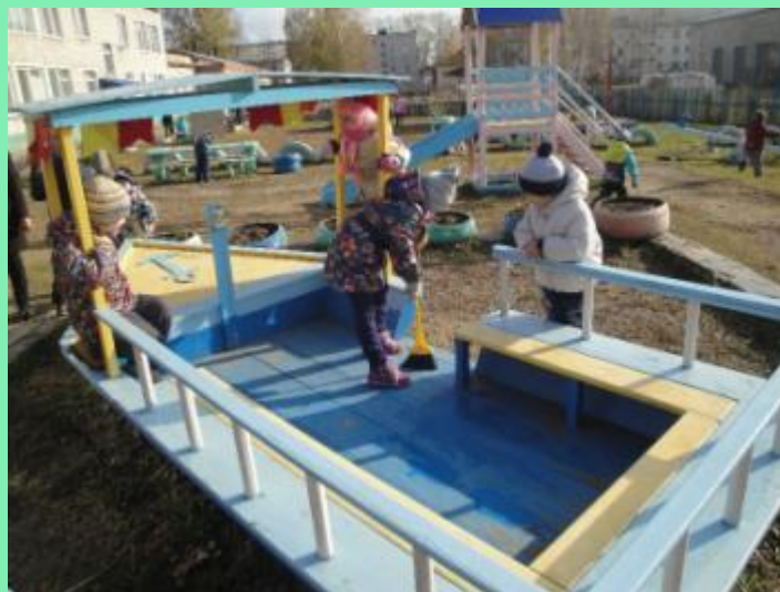
«Навести порядок в домике и на корабле»