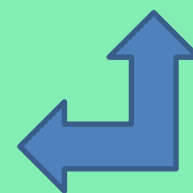
«Навести порядок в домике и на корабле»