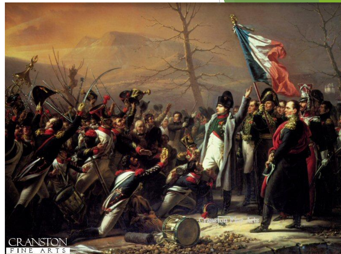
Наполеон на Эльбе