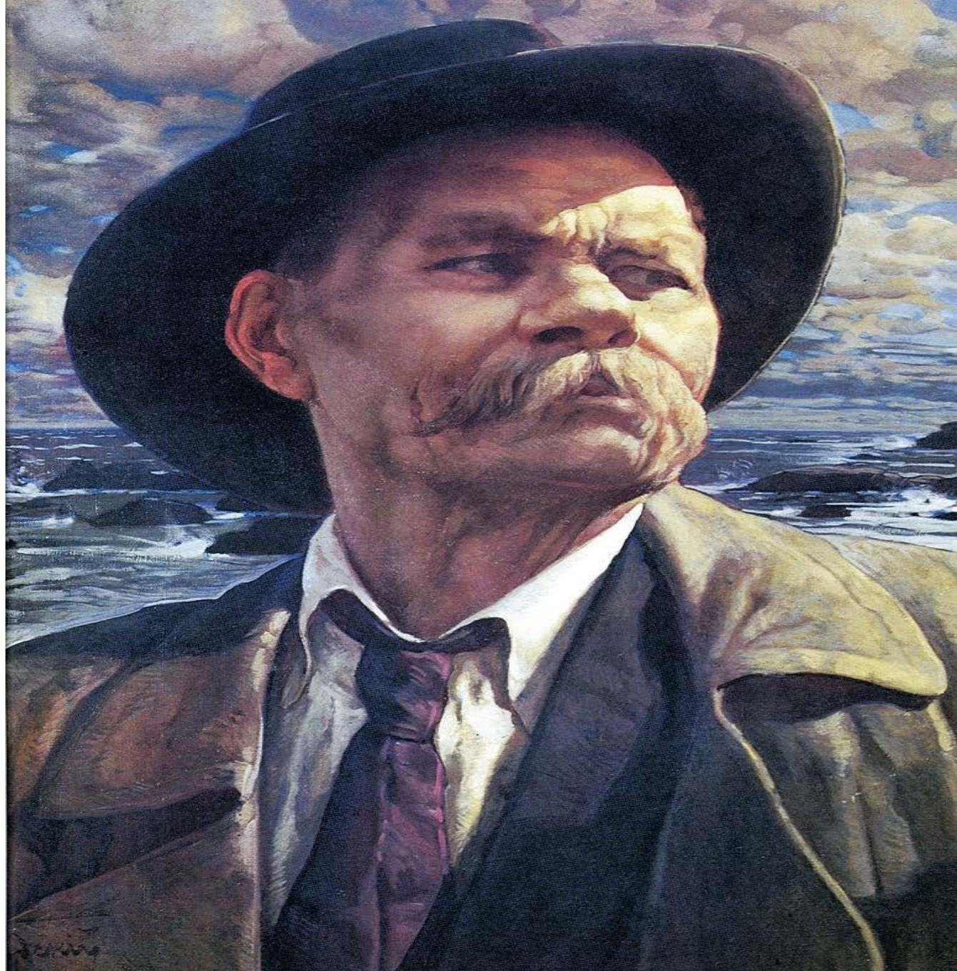
Портрет Горького. Художник И.И. Бродский. 1937 г.