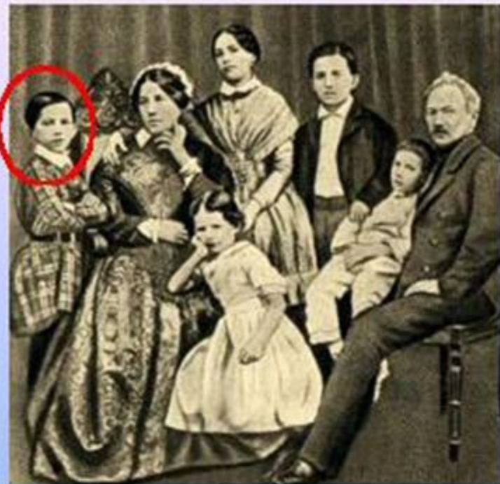
Семья Чайковских в 1848 году (крайний слева — Пётр Ильич)

Родился 25 апреля 1840 года в селении при Камско - Воткинском заводе Вятской губернии (ныне город Воткинск, Удмуртия). Пётр был вторым ребёнком в семье.