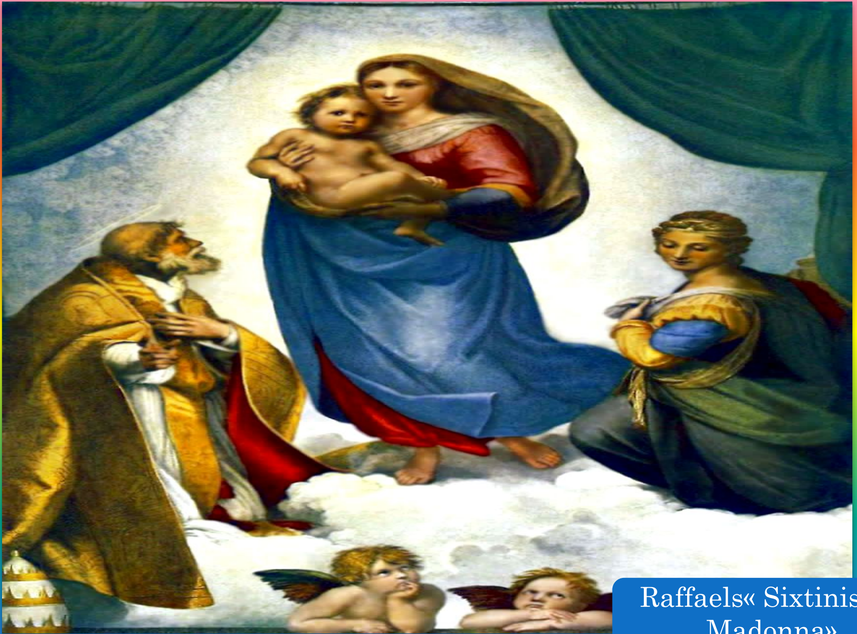
Raffaels « Sixtinische Madonna »