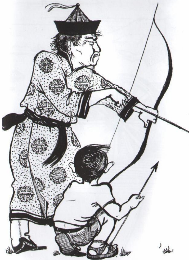
Из серии «Сур-харбан»