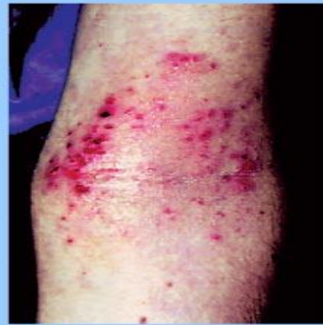
Рис. 14 Атопический дерматит у больного с внешнесекреторной недостаточностью поджелудочной железы