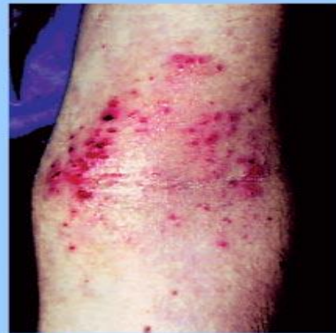
Рис. 14 Атопический дерматит у больного с внешнесекреторной недостаточностью поджелудочной железы