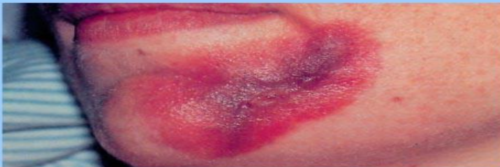
Рис. 15 Гангренозная пиодермия