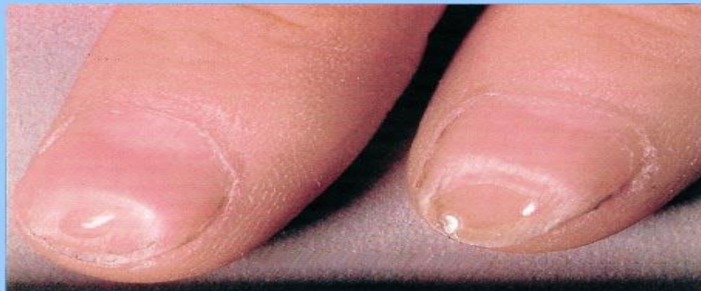
Рис. 13 Койлонихии