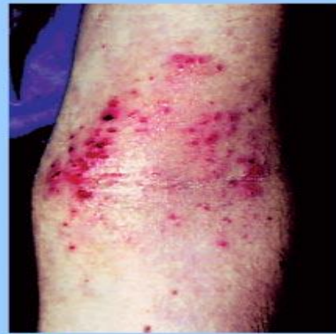
Рис. 14 Атопический дерматит у больного с внешнесекреторной недостаточностью поджелудочной железы