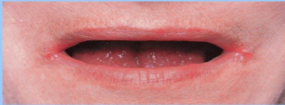
Рис. 12 Ангулит