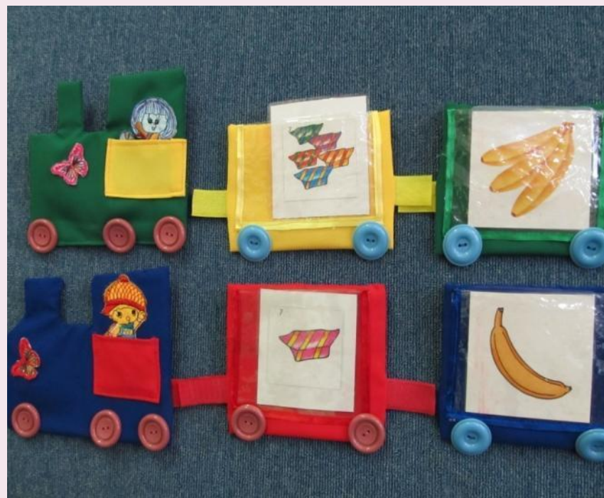
«Один – много»