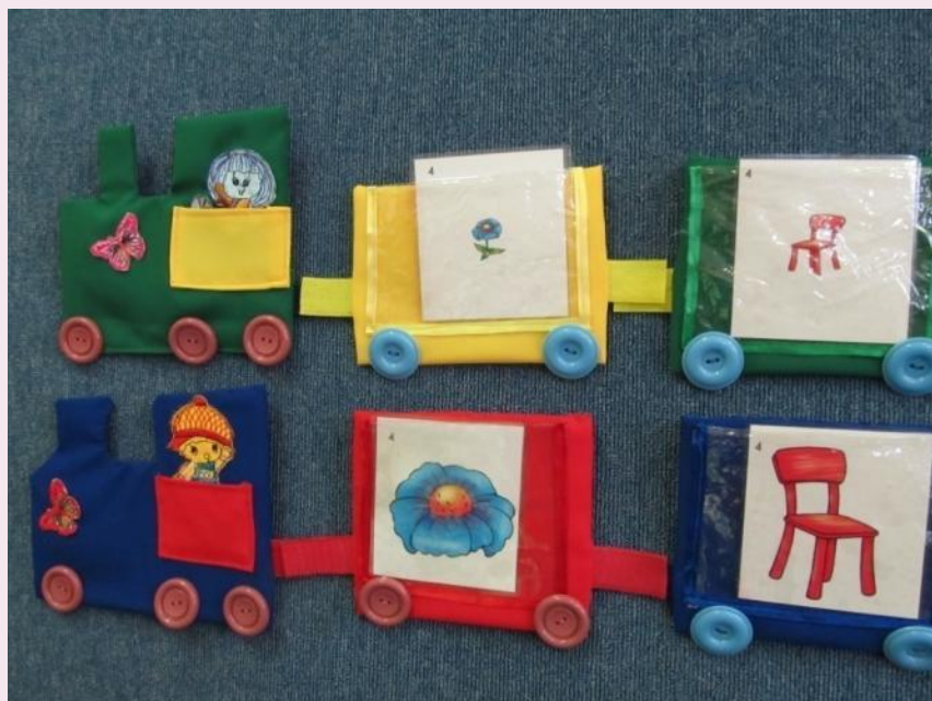
«Большой – маленький»