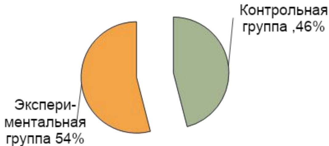
График фиксации актуального уровня развития детской инициативы и самостоятельности контрольной и экспериментальной групп