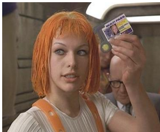
Милла Йовович — Лилу