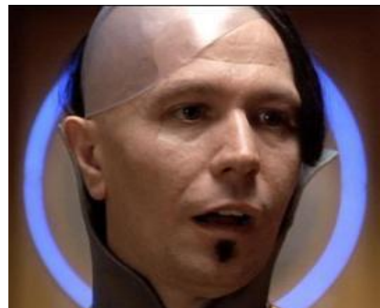
Гэри Олдман- Зорг