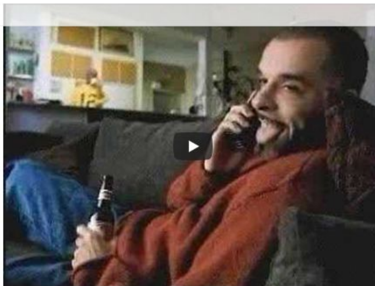
Оригинальная реклама Budweiser bull57123

В финале оригинальной версии рекламы, которая вышла в 2000 году, один из друзей приносил ящик пива и кричал «Wassup!». В новом ролике на его месте король Бургеров, держащий в руках пакет из Burger King. И он тоже кричит «Wassup!»!