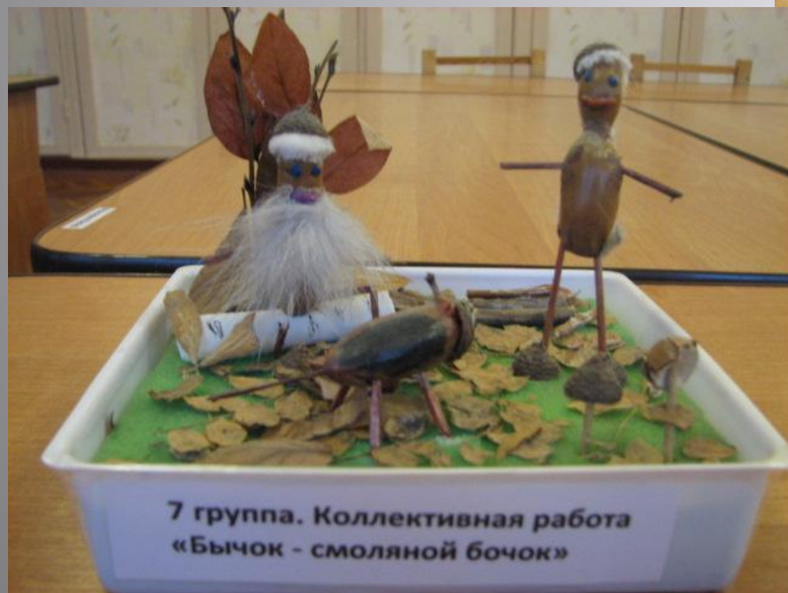
7 группа. Коллективная работа «Бычок - смоляной бочок»