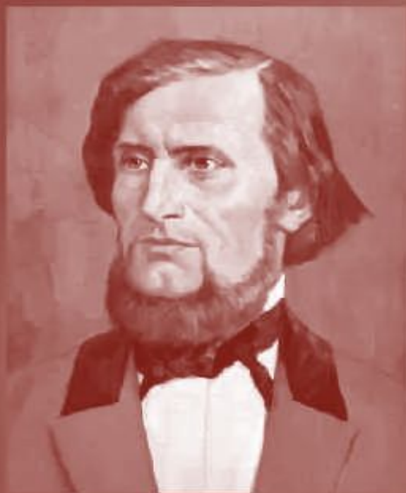
К. Д. Ушинский

«Учитель только в той мере воспитывает и образовывает, в какой он сам воспитан и образован, и только до тех пор он может воспитывать и образовывать, пока сам работает над своим воспитанием и образованием»