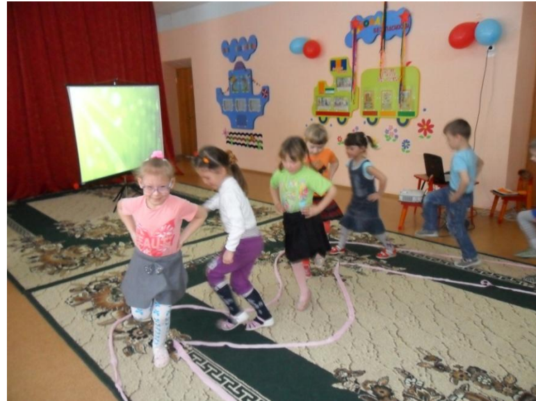
Непосредственно образовательная деятельность