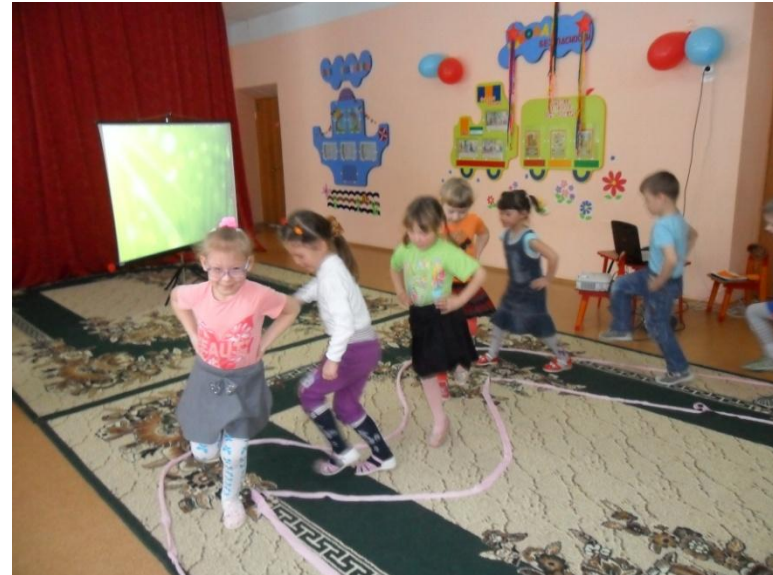
Непосредственно образовательная деятельность