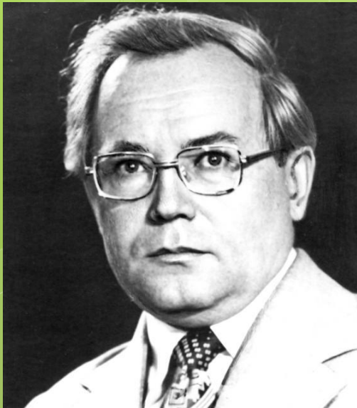
А. П. Ершов