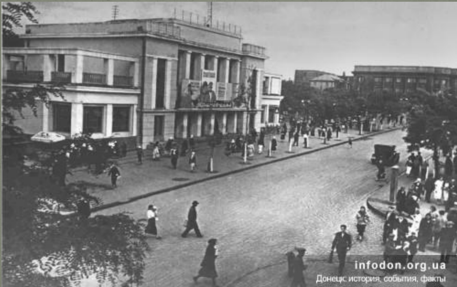
Кинотеатр «Комсомолец», фото 1938 г.

Создается разветвленная сеть культурно-просветительских учреждений, возникают театры, библиотеки, клубы, развивается кинофикация. С 1923 года начинает печататься литературно-художественный журнал «Забой». Развивается музыкальное творчество. В 1930 г. была создана филармония, кинофикация.