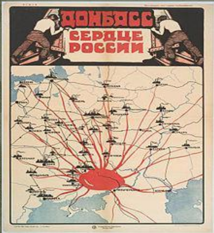
Плакат 1921 года. «Донбасс — сердце России»