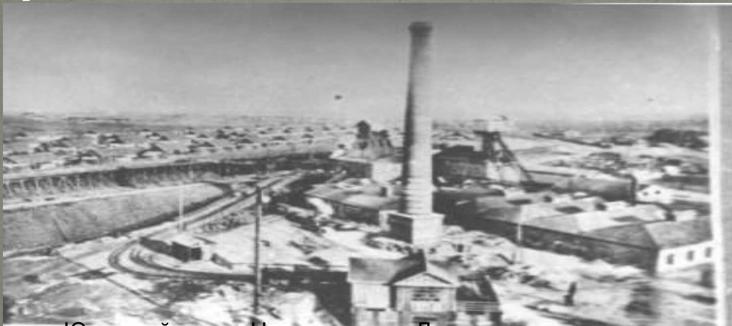
Юзовский завод. Нынче зовется Донецким металлургическим.