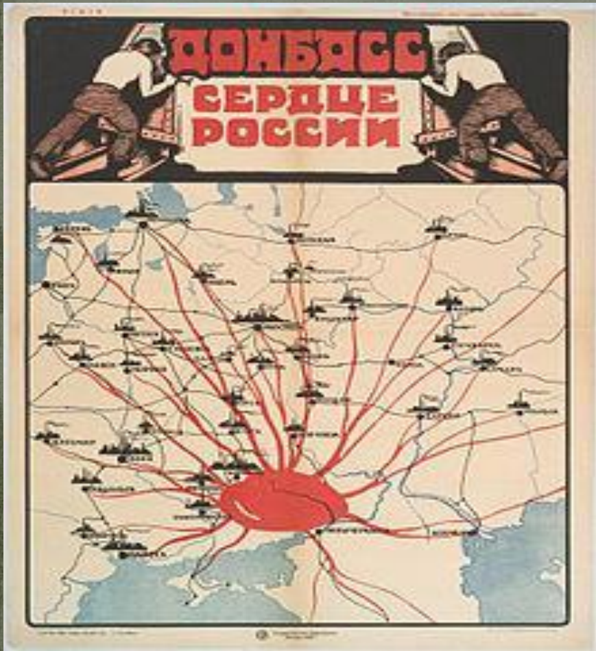
Плакат 1921 года. «Донбасс — сердце России»