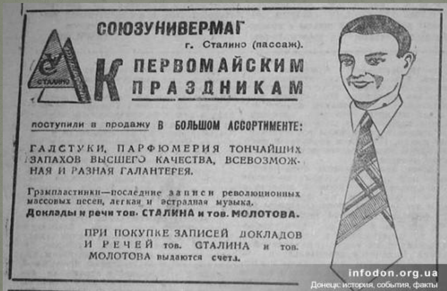
Реклама Пассажа города Сталино (Донецк)

Активно развивается легкая и пищевая промышленность. В 1936 году в Донецком крае числится 45 предприятий этой промышленности.