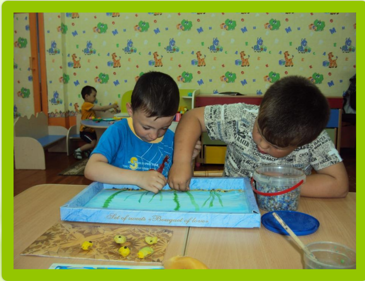
Изготовление сухого аквариума