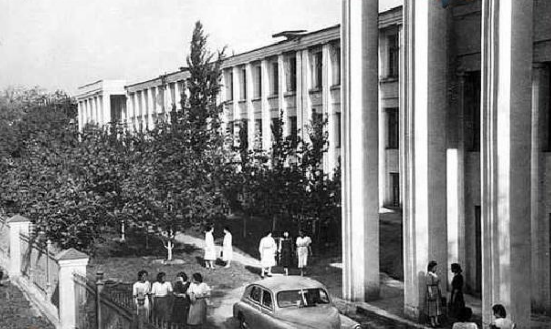
1931 году был открыт Алматинский медицинский институт