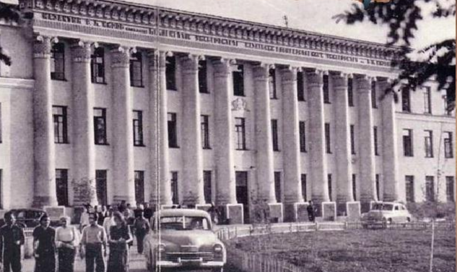
1934 году был открыт Казахский Государственный институт