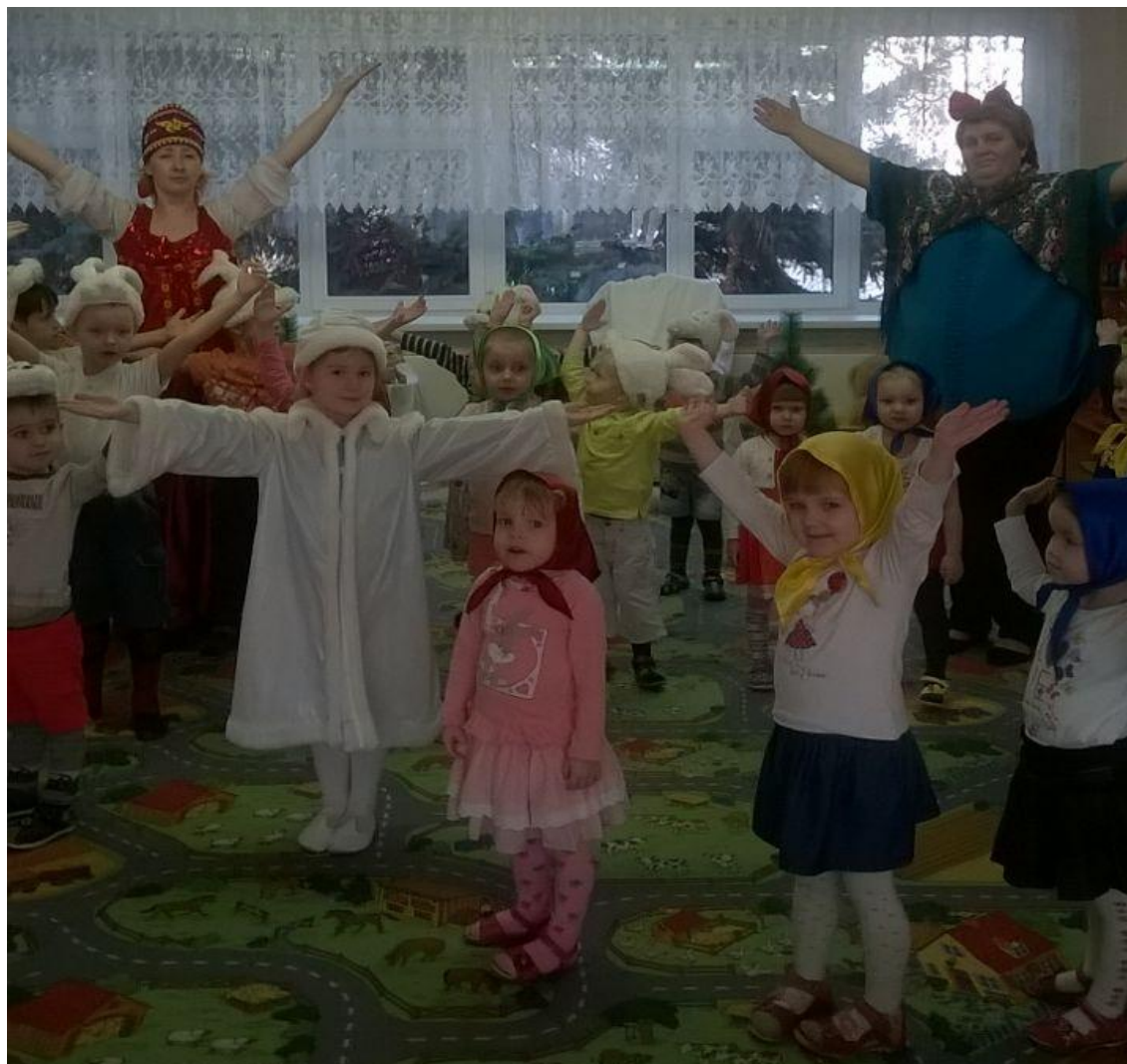
Заключительный танец « Дед Мороз и Валенки!»