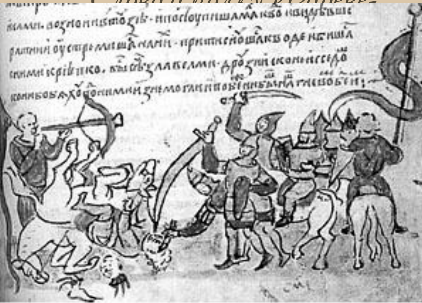
Бой Игоря Святославовича с половцями. Миниатура из летописи