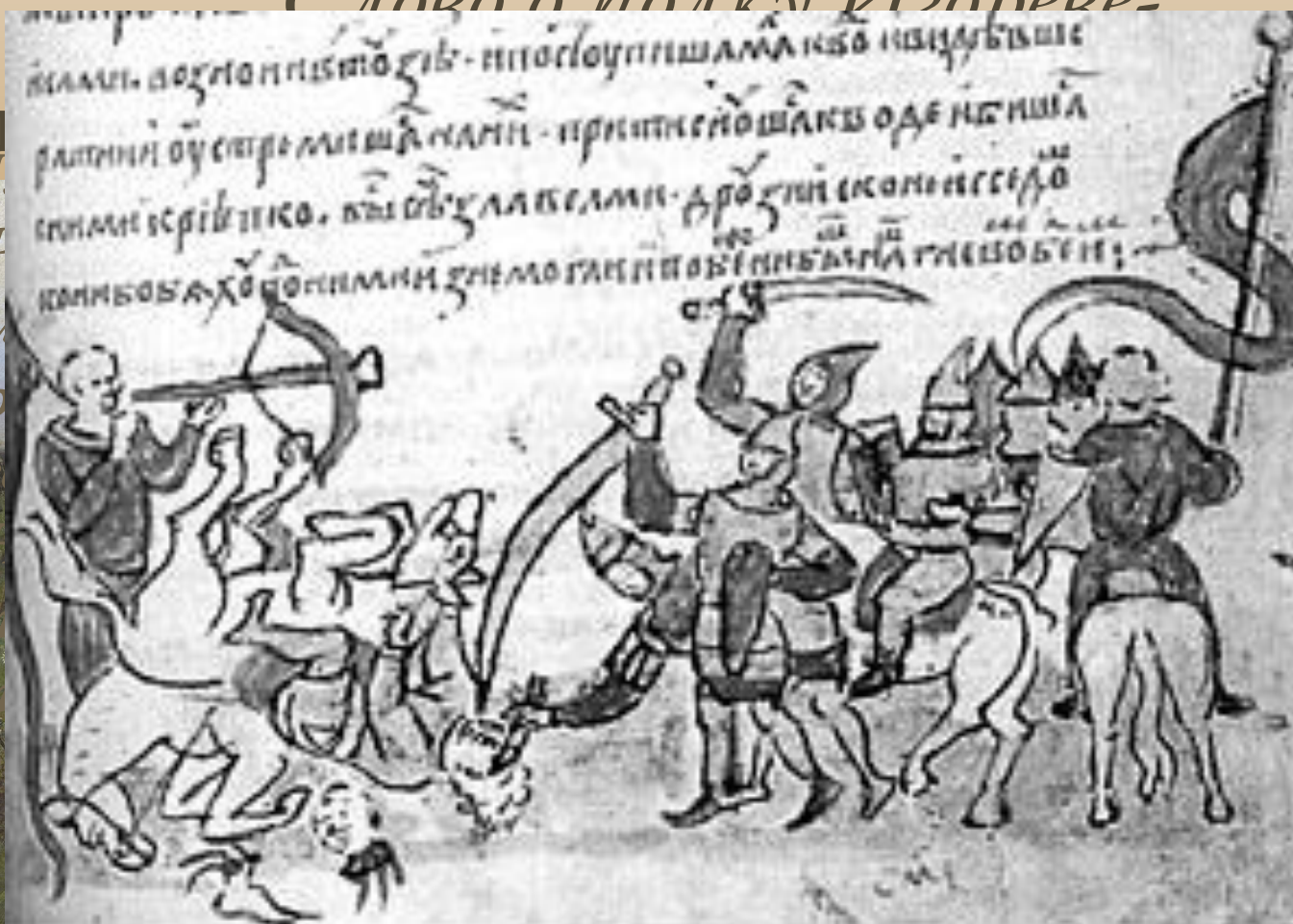
Бой Игоря Святославовича с половцями. Миниатура из летописи