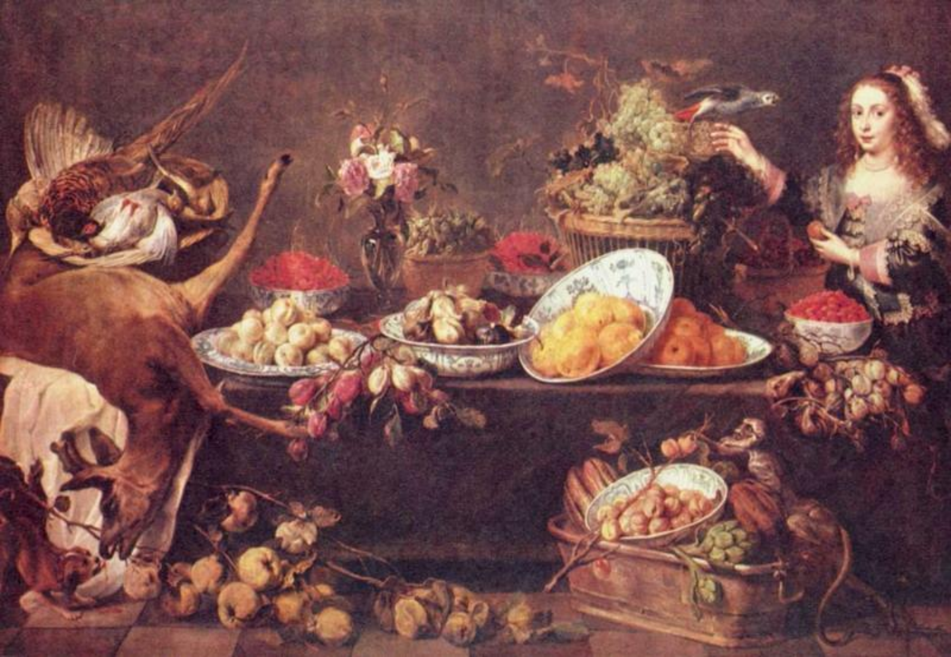
П. П. Рубенс (1577-1640) «Великий натюрморт з дамою і пудучкою»