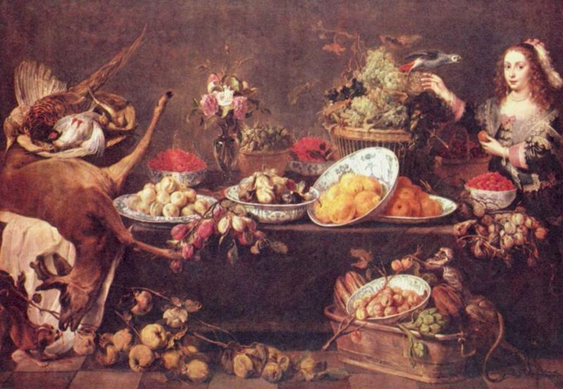
П. П. Рубенс (1577-1640) «Великий натюрморт з дамою і собакою»