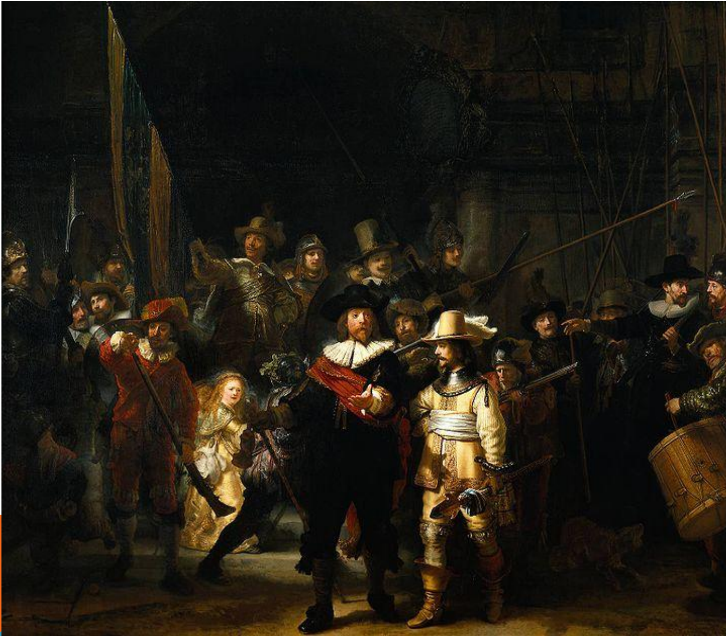
Рембрандт. "Нічна варта"