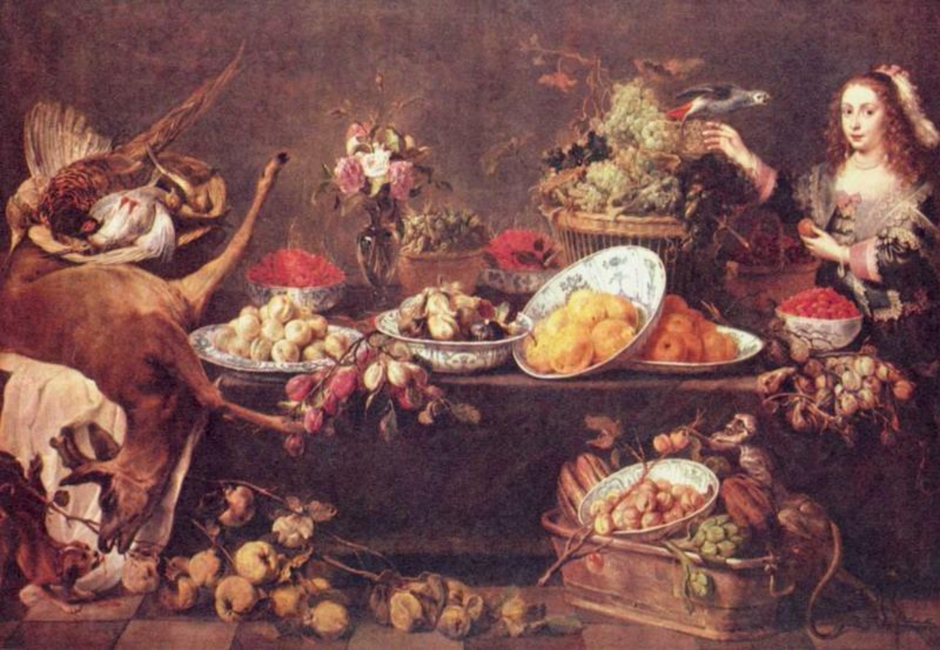
П. П. Рубенс (1577-1640) «Великий натюрморт з дамою і папугою»