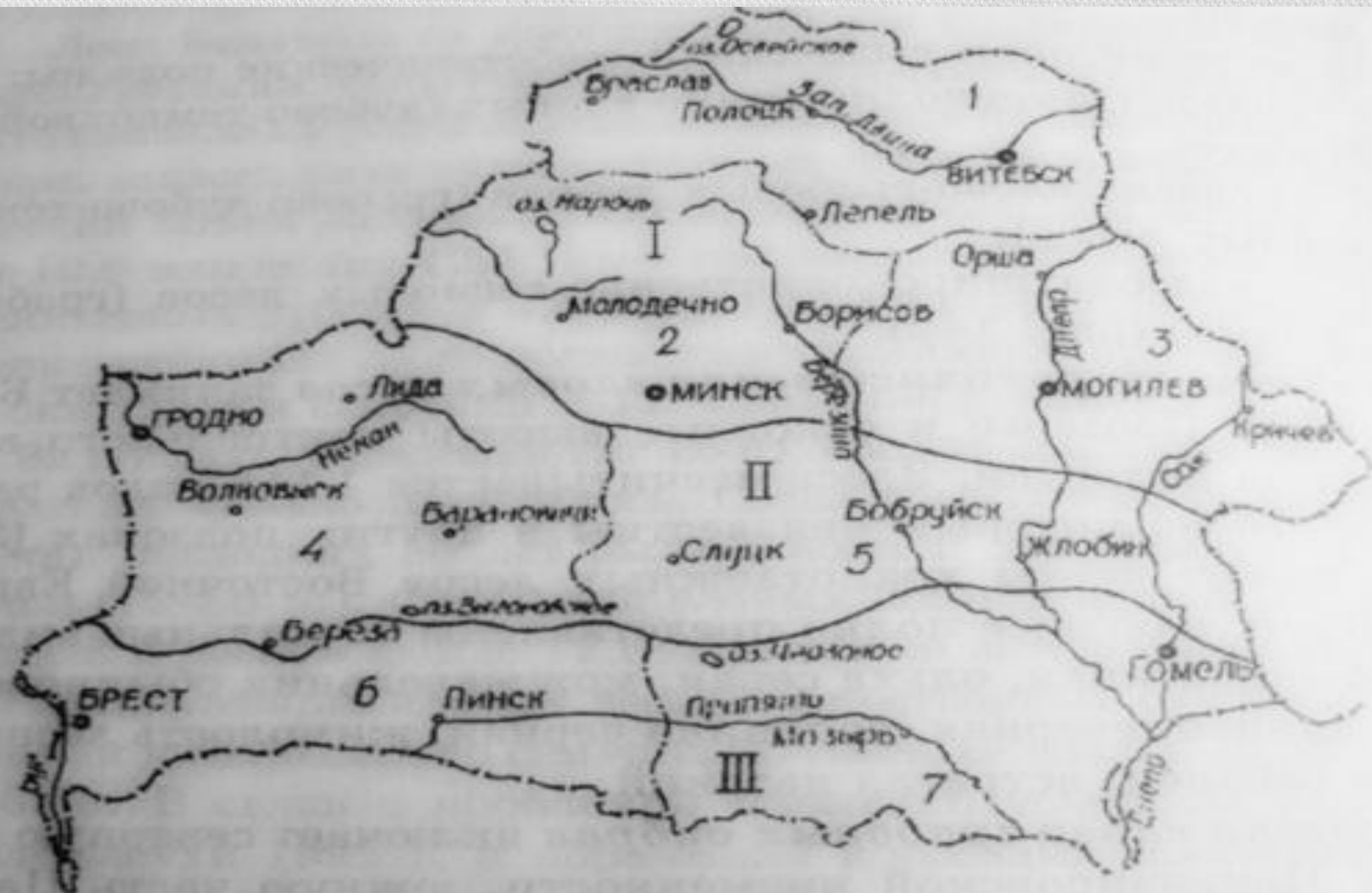
Рис. 142. Геоботаническое районирование Беларуси:

Подзоны: I – широколиственно-еловых (дубово-темнохвойных) лесов; II – елово-грабовых дубрав (грабово-дубово-темнохвойных лесов); III – грабовых дубрав (широколиственно-сосновые леса). Лесорастительные районы: 1 – Западно-Двинский; 2 – Ошмяно-Двинский; 3 – Оршанско-Могилевский; 4 – Неманско-Предполесский; 5 – Березинско-Предполесский; 6 – Бугско-Полесский; 7 – Полесско-Приднепровский.