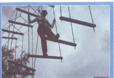
Любое препятствие Преодолевается настойчивостью