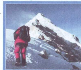
Вы можете получить все, что хотите, если достаточно от себя требуете, что это неслыханно.

Сила духа делает человека непобедимым. (В.А. Сухомлинский)