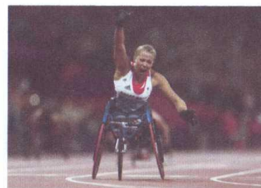
желании преодолеть себя