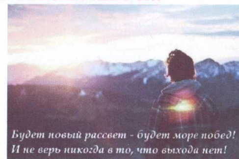
Будет новый рассвет - будет море побед! И не верь никогда в то, что выхода нет!