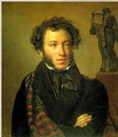
А. С. Пушкин

«Ничтожные наследники северного исполина».