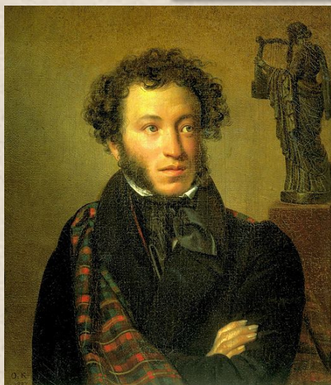
А. С. Пушкин

«Ничтожные наследники северного исполина».