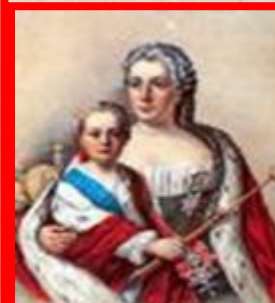
Анна Леопольдовна Иван VI