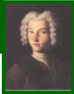
Петр II 1727-1730