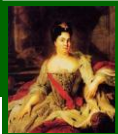
Екатери на I 1725-1727