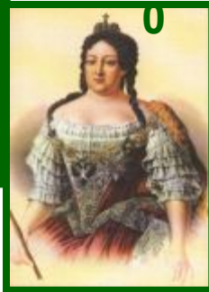
Анна Иоаннов на 1730-1740