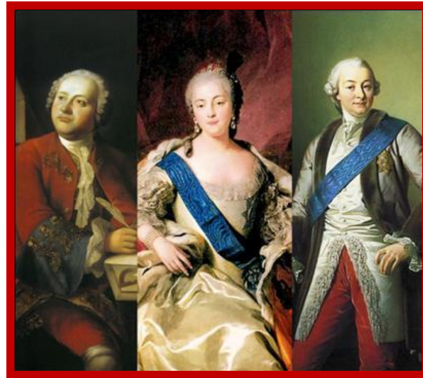
Михаил Васильевич Ломоносов, императрица Елизавета Петровна, Иван Иванович Шувалов.