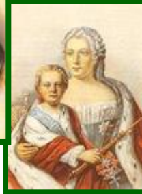
Иван VI Антонович и Анна Леопольдовна 1740-1741