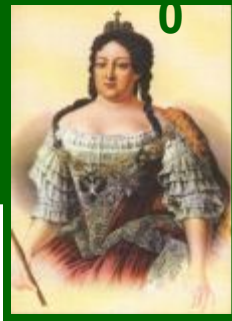
Анна Иоаннов на 1730-1740