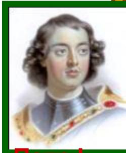
Петр I 1682-1725

Период в истории России с 1725 по 1762 гг.