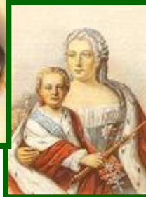
Иван VI Антонович и Анна Леопольдовна 1740-1741