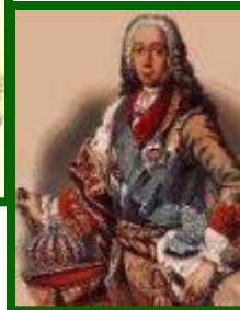
Петр III 1761-1762