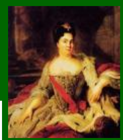
Екатери на I 1725-1727