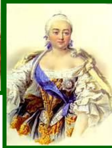
Елизавета Петровна 1741-1761