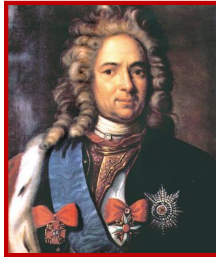
Александр Данилович Меншиков