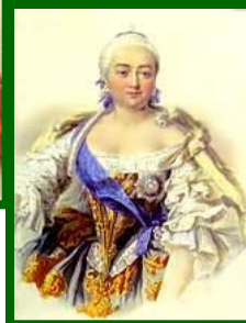
Елизавета Петровна 1741-1761