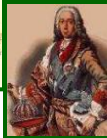
Петр III 1761-1762