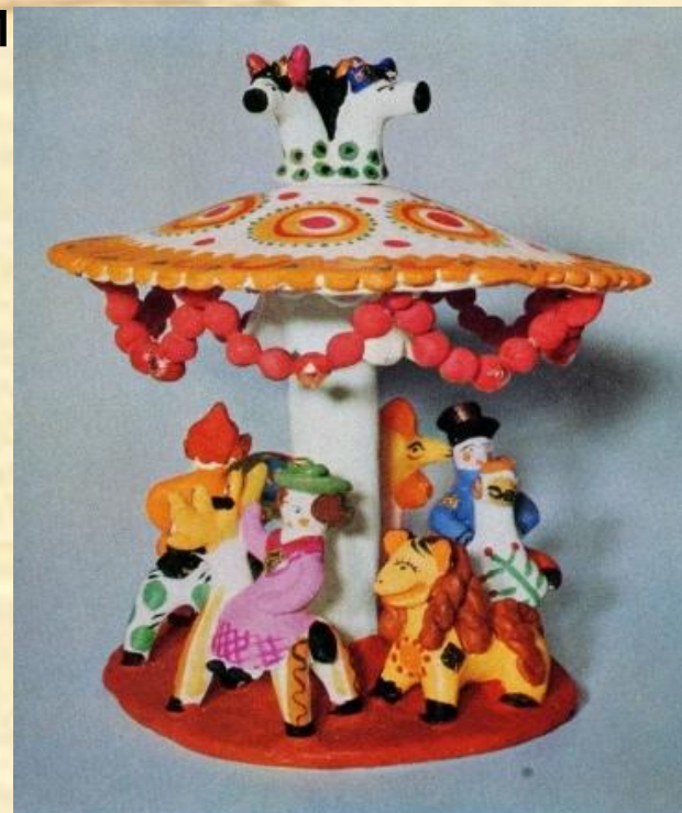
Дымковская игрушка. XIX в.