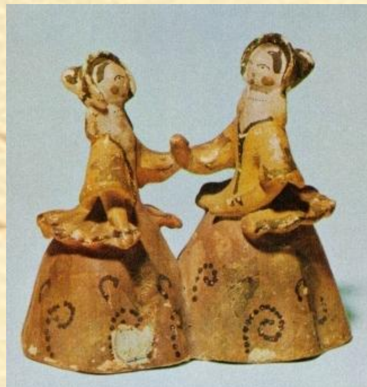
Дымковская игрушка. XIX в.

Изготавливали игрушки в слободе Дымково целыми семьями, копали и месили глину, вручную толкли и растирали краскотерками комовой мел, с осени до весны лепили, сушили и обжигали. Ближе к началу ярмарки «Свистуньи-свистопляски», которая проходила в четвертую субботу после Пасхи, игрушки белили мелом, разведенным на снятом коровьем молоке, красили яичными красками, украшали большими пятнами золотистой потали. А затем на лодках привозили яркий самобытный товар в город Вятку на праздник, радуя своим искусством детей и взрослых