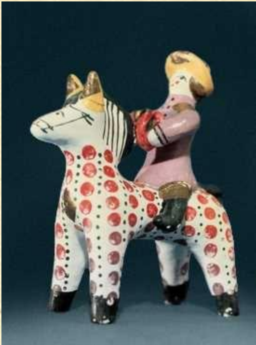
Дымковская игрушка. Е. И. Пенкина. «Гармонист на коне».