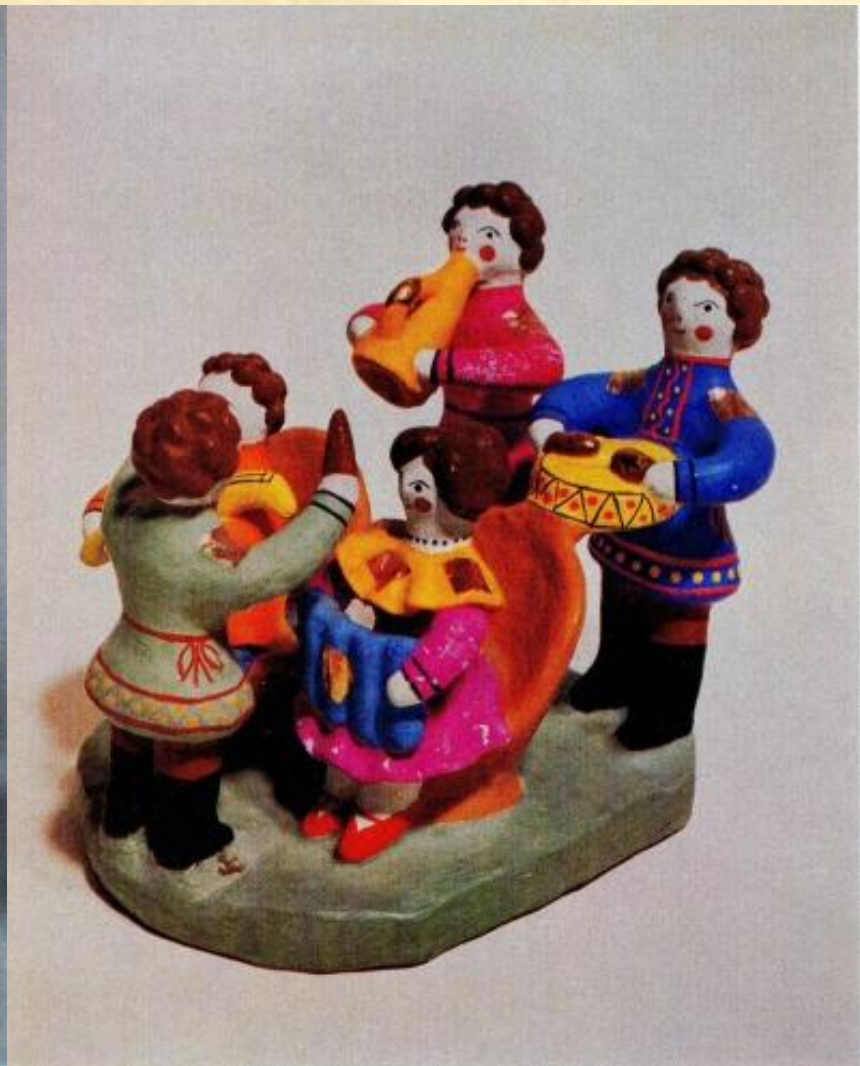
Дымковская игрушка. XIX в.