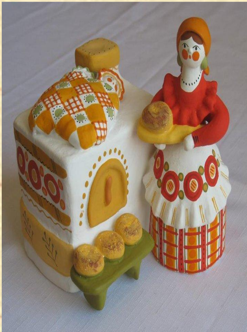
Современная дымковская игрушка. Автор неизвестен.