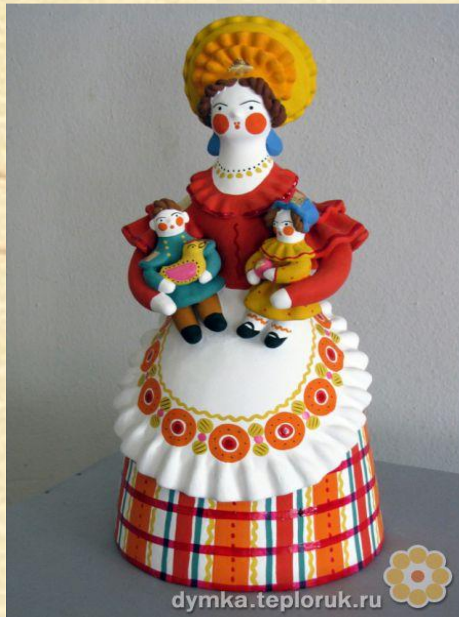
«Нянька». Выставка дымковской игрушки «Четыре русских солнца». Автор