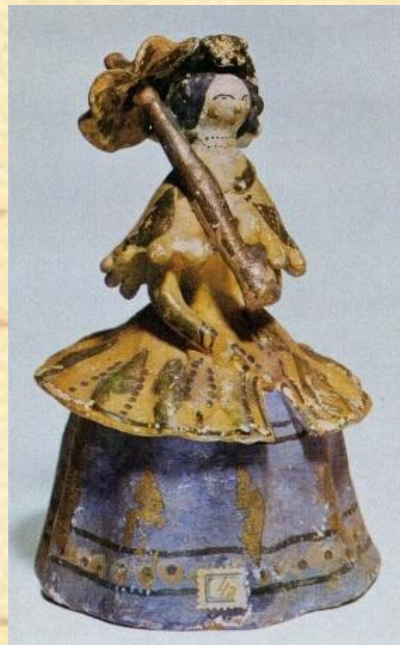
Дымковская игрушка. XIX в.

Дымковский промысел — уникальное явление русского народного искусства, пришедшее к нам из глубины веков. Считается, что возник он в XV–XVI веках в слободе Дымково, на низком правом берегу реки Вятки, возле города Хлынова-Вятки. Именно там развилась и сложилась потомственная традиция изготовления глиняной игрушки по женской линии, передаваемая от матери к дочери. Постепенно складывались династии мастериц дымковской игрушки: Никулины, Пенкины, Кошкины... Каждая из них имела свои особенности изделий в форме и пропорциях, колорите и орнаментах. Здесь, в слободе, в XIX веке жили и работали от 30 до 50 семей