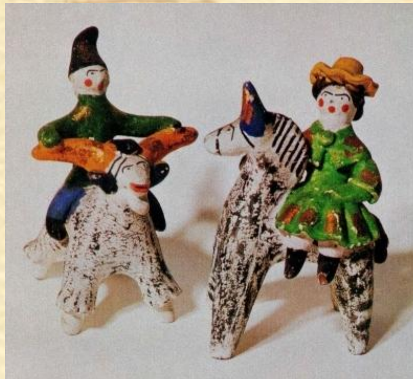
Дымковская игрушка. XIX в.