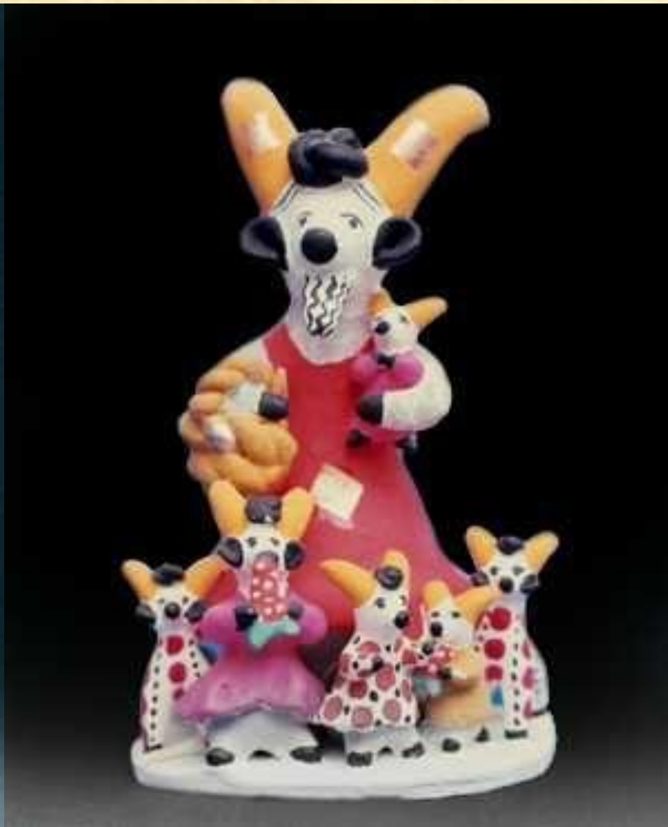
Дымковская игрушка. Е. И. Косс-Деньшина. 1969