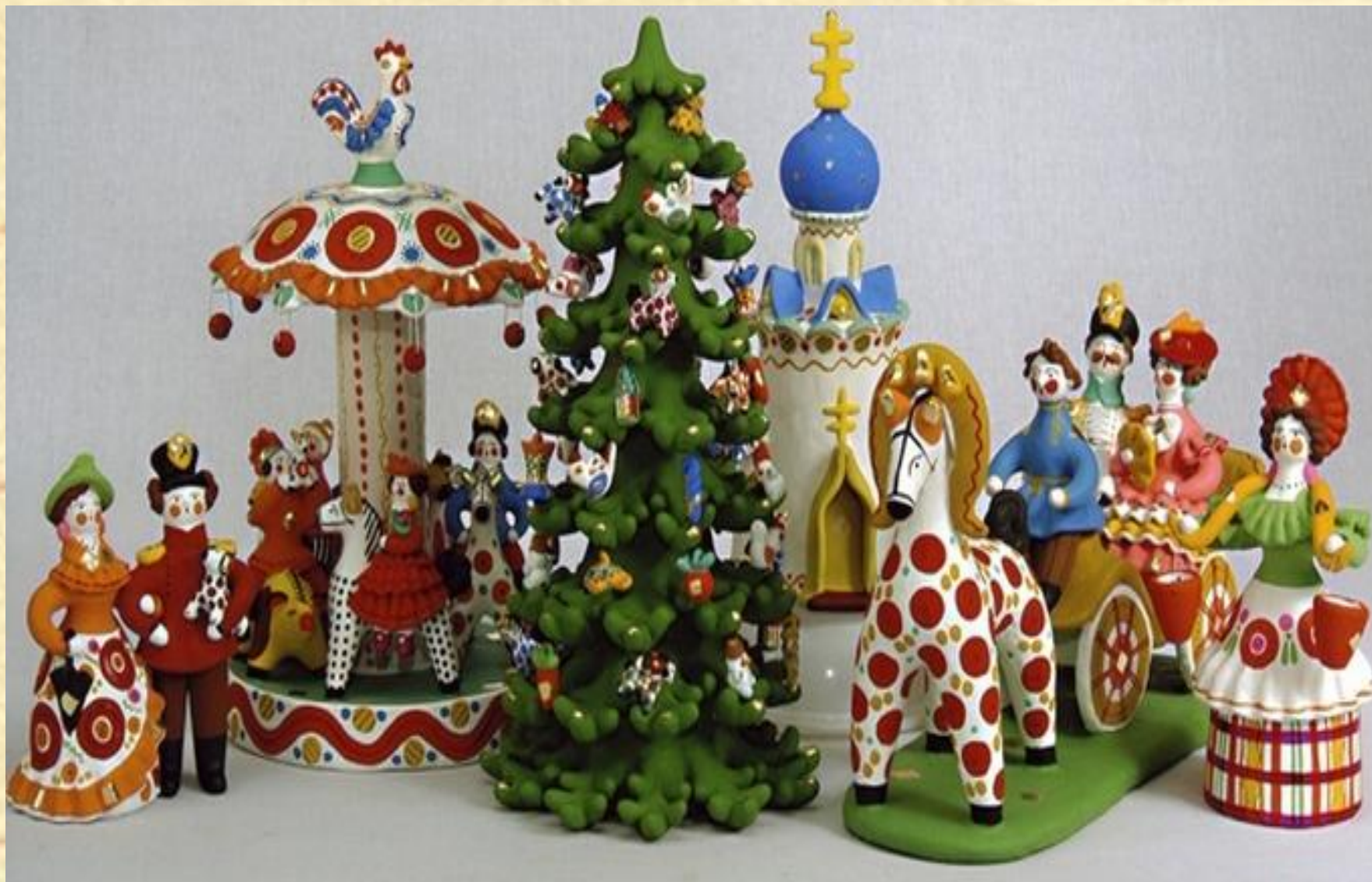
Современная дымковская игрушка. Автор неизвестен.