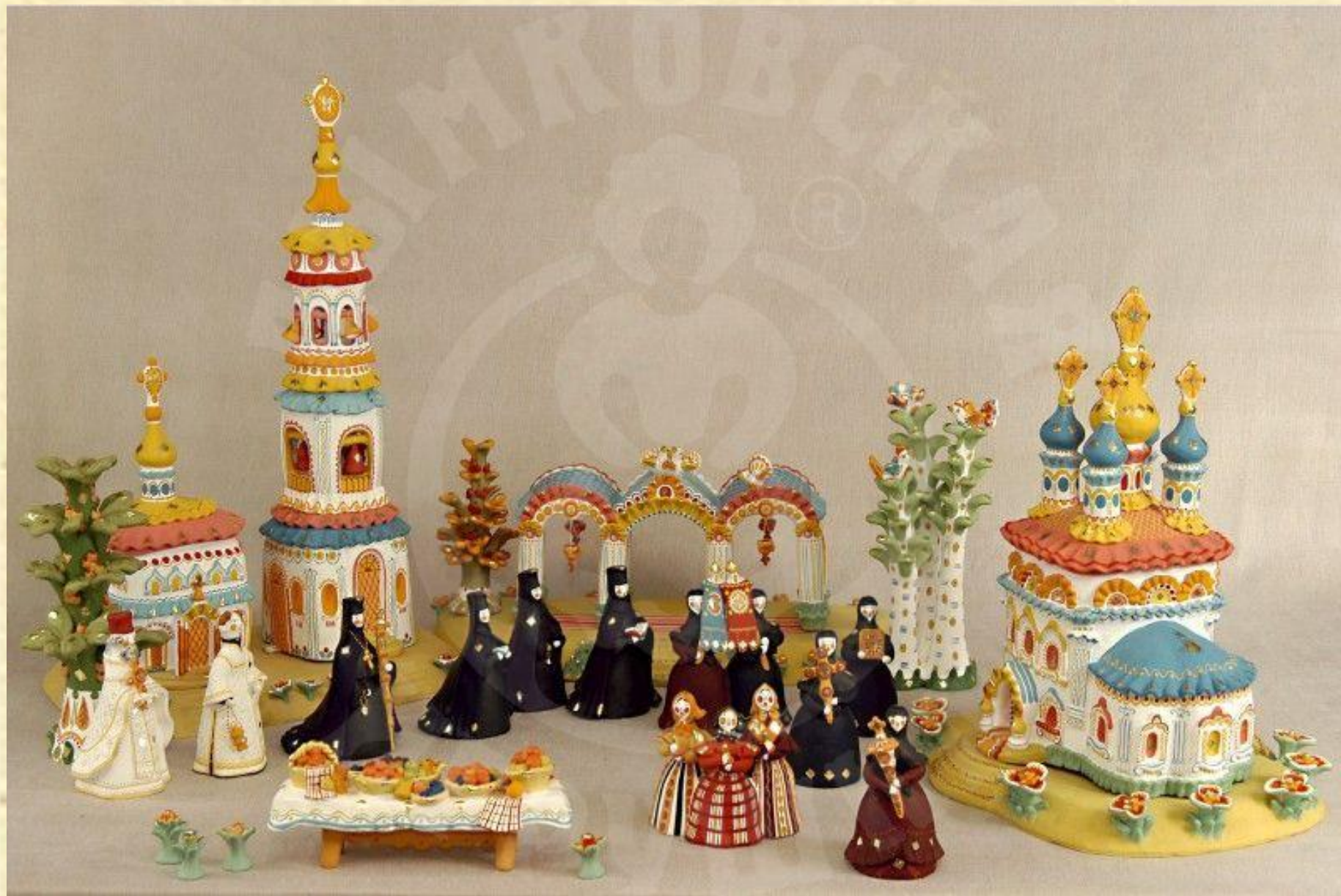
Композиция «Праздник Преображения. Крестный ход». Автор: Верещагина Л. Д.