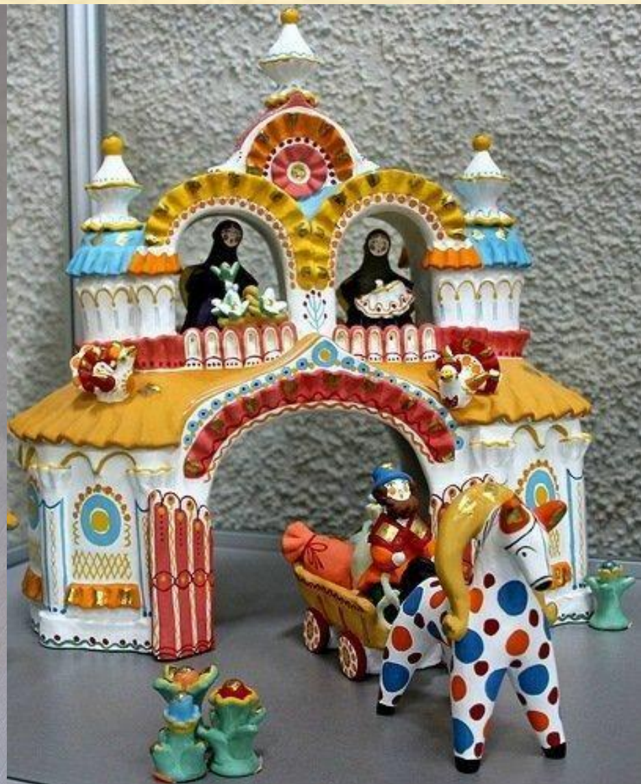
Часть творческой работы «Праздник Преображения» Автор: Верецагина Л. Д.