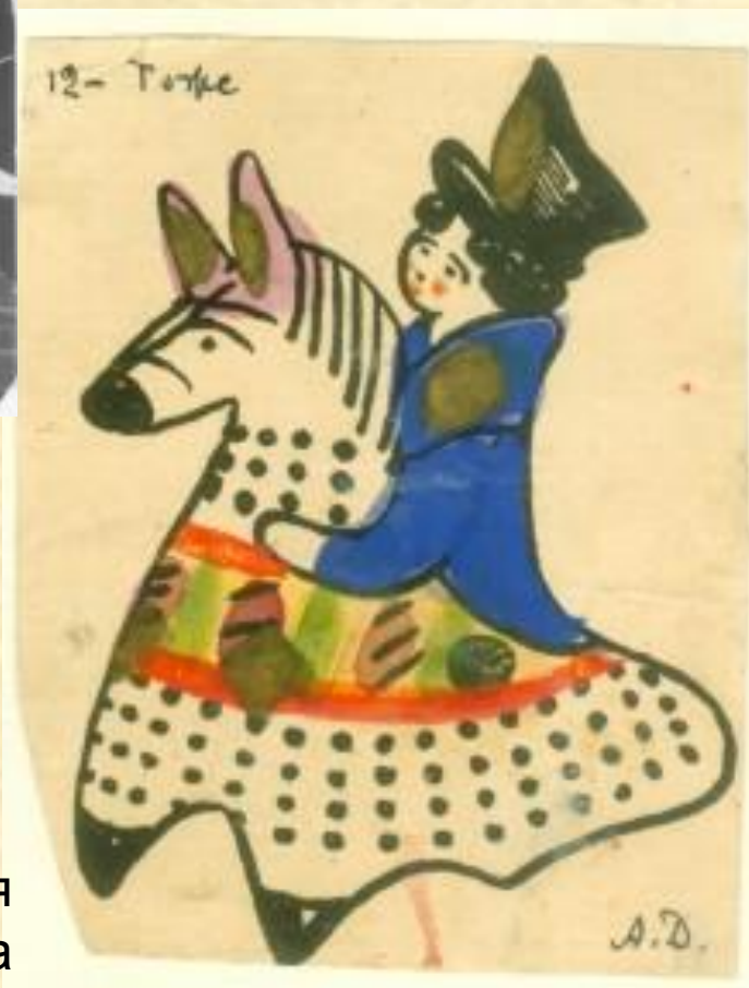
А.И. Деньшин Зарисовка игрушки для альбома