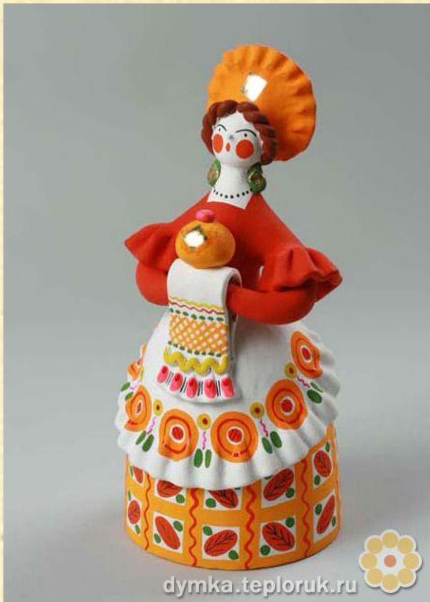
Барыня. Автор: Втюрина Л. А.