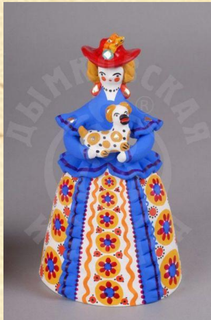
«Барыня с собачкой» Автор: Трухина Н. П.

Но разница в том, что современная мастерица освобождается от всех не творческих процессов, выполняемых другими людьми (обработка глины, изготовление побелки, обжиг), отдавая все свое время непосредственно искусству создания дымковской игрушки — творчеству.