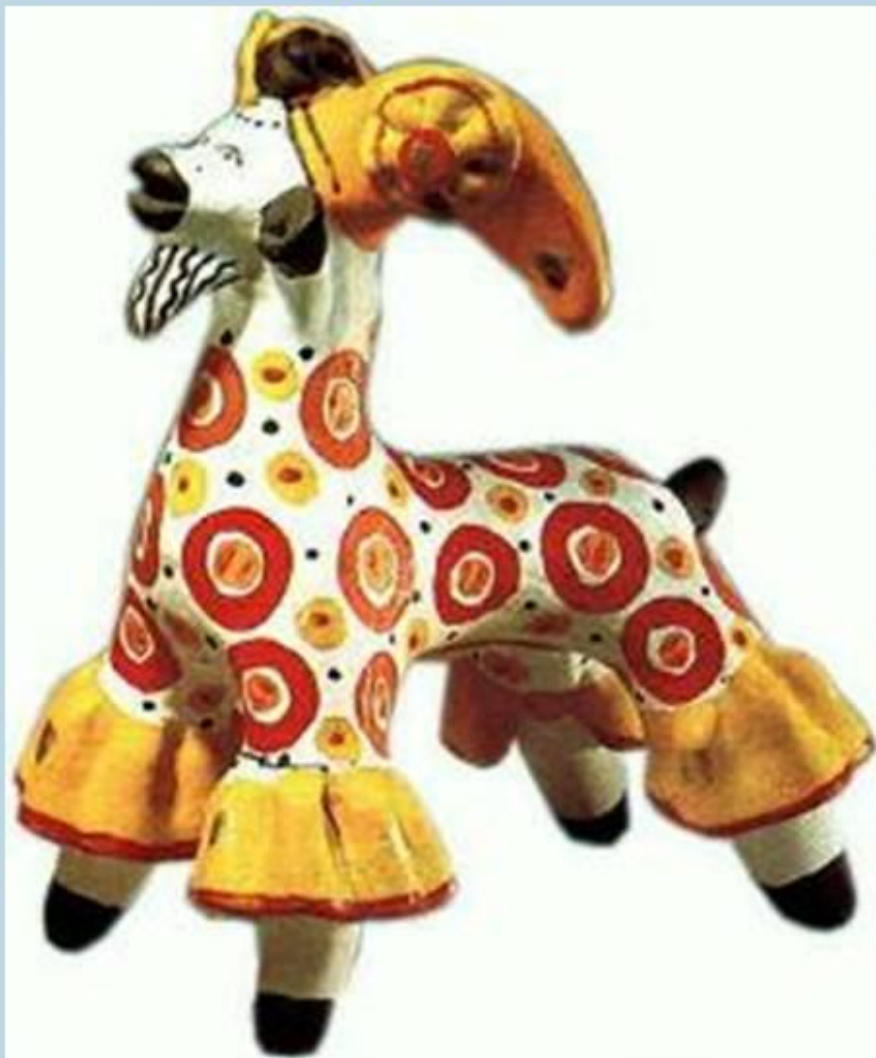
Цирковой козел. Дымковская игрушка.

В селе Дымково близ Вятки изготавливали глиняные игрушки-свистульки в виде людей, животных, птиц. Их раскрашивали яркими анилиновыми красками. Характерной чертой дымковской игрушки стали пышные воротники, оборки, яркий геометрический орнамент.